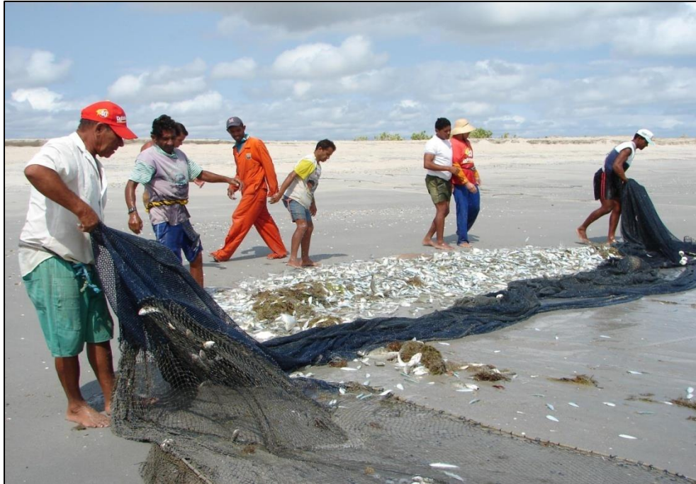
Figura 2 – Pesca de tresmalhos na restinga.