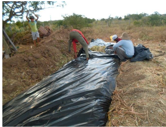
Figuras 03 e 04 – Produção do adubo orgânico em comunidades rurais no município de São Domingos, 2015.