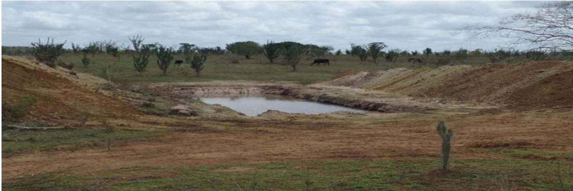
Figura 11 – Barreiro para armazenar água da chuva na propriedade da agricultora 03 em comunidades rurais no município de São Domingos, 2016.