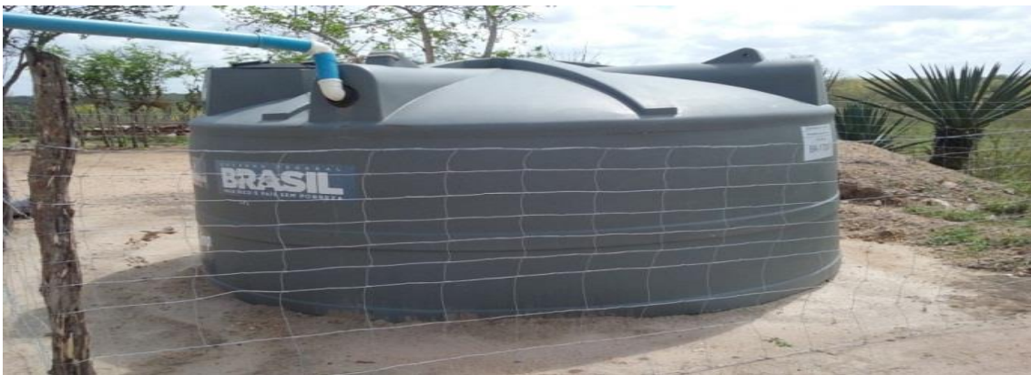
Figura 12 – Cisterna para armazenar água da chuva para consumo humano. Captada pelo telhado da casa da propriedade da agricultora 04 em comunidades rurais no município de São Domingos, 2016.