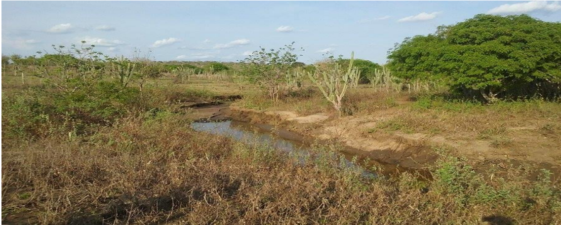
Figura 08 – Mata ciliar do riacho em processo de recuperação na propriedade do agricultor 07 em comunidades rurais no município de São Domingos, 2016.