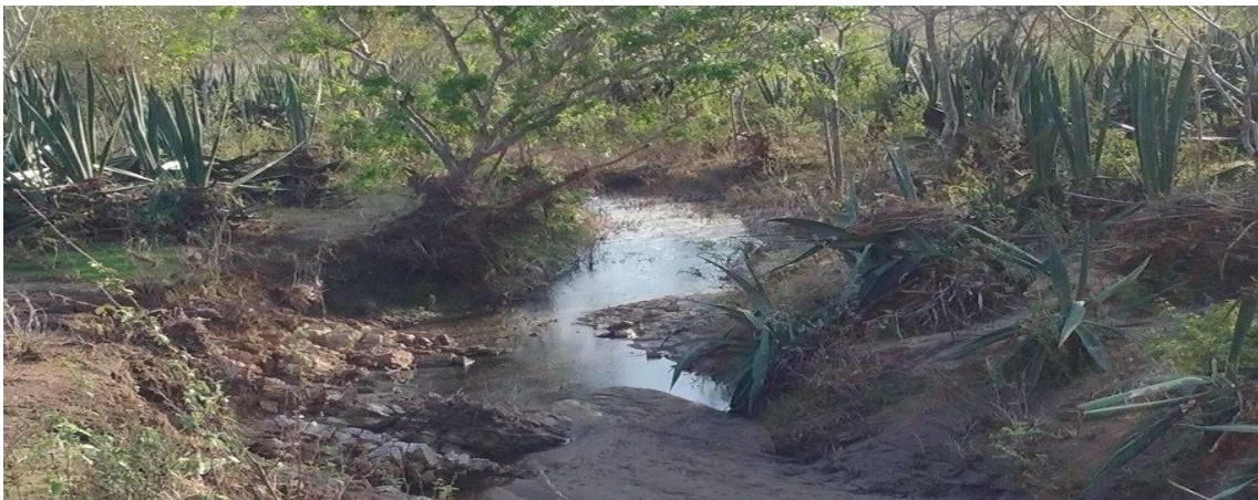
Figura 09 – Riacho possivelmente degradado com plantação de sisal às margens e vestígios de assoreamento e erosão na propriedade da agricultora 01, no município de São Domingos, 2016.

Os atuais quadros ambientais das propriedades denunciam que predominava uma visão de pura produção sem nenhum cuidado com o ambiente. Contudo, observou-se também que essa visão vem sendo substituída por práticas que minimizem a degradação em áreas já prejudicadas por conta da produção do sisal, ainda predominante no município. Contrapor essa lógica de produção do sisal significa pensar em uma agricultura familiar rentável e agroecológica para que os sujeitos não fiquem exclusivamente ligados ao ciclo do sisal e aos processos de degradação a ele relacionados.