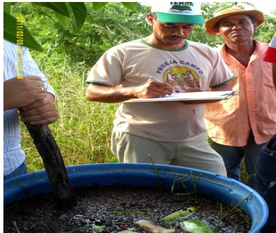
Figuras 05 e 06 – Produção de biofertilizante natural em comunidades rurais no município de São Domingos, 2015.

Tais ações articuladas e desenvolvidas pelo sindicato, para os agricultores familiares, proporcionam para eles uma nova visão de produção, tornando possível uma agricultura dialógica com o meio ambiente, mudando significativamente a própria ideia de “uso dos recursos naturais”. Reproduzir esses modos de produção agrícola a nível local gera gradativamente mudanças significativas na agricultura e no pensamento do homem do campo em relação ao próprio campo, fazendo dessa relação algo saudável e positivo para ambas as partes.