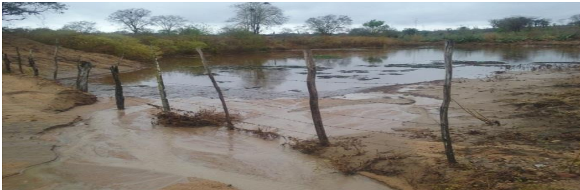
Figura 10 – Aguada na propriedade da agricultora 01.

As antigas formas de abastecimento de água como as aguadas (tanques) ainda continuam sendo utilizadas (Figura 10), porém novas técnicas vêm sendo implementadas, tais como os barreiros (Figura 11) e as cisternas (Figura 12), através do programa Água Para Todos, do Governo Federal, o qual visa ao armazenamento de água para o consumo humano e para a produção agrícola, distribuindo duas cisternas em média para cada grupo familiar.