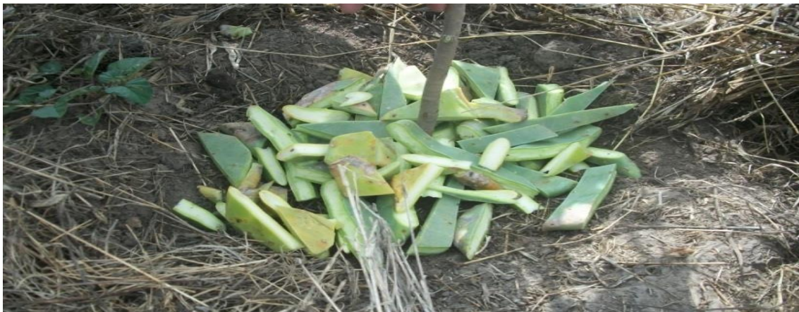
Figura 02 – Utilização da palma forrageira para conservar a umidade no solo em comunidades rurais no município de São Domingos, 2015.

Seguindo a lógica da narrativa acima, observa-se que o carro-chefe da concepção de sustentabilidade, proposta para a agricultura familiar do município, está ligado diretamente à Agroecologia. Essa nova perspectiva de agricultura baseia-se em uma produção pautada na sustentabilidade, o que dialoga positivamente com as atividades exercidas pelo sindicato e em conjunto com os agricultores familiares, tais como o manejo de cobertura do solo com forragem da palma para aumentar a durabilidade da umidade do solo (Figuras 02), a produção do adubo orgânico (Figuras 03 e 04), a irrigação por gotejamento e a produção de biofertilizante natural (Figuras 05 e 06).