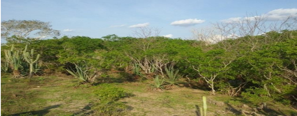
Figura 07 – Área de preservação da caatinga na propriedade do agricultor 07 em comunidades rurais no município de São Domingos, 2016.