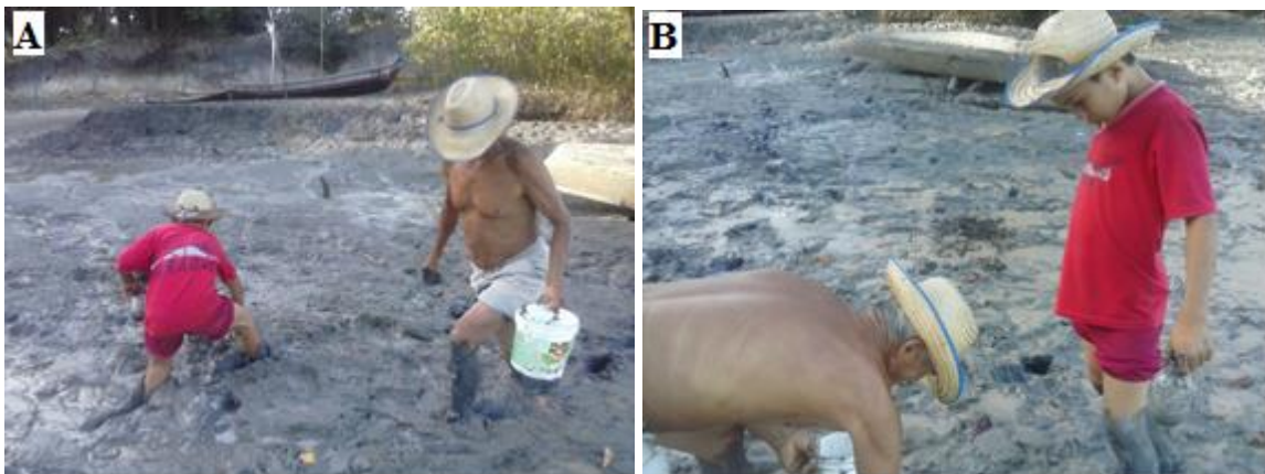
Figura 4 – (A) Criança ajudando seu avô a catar o sarará; (B) É na percepção que a Criança apreende o mundo, em uma intimidade espacial, sempre em conjunto com a realidade vivida: a paisagem.

Entende-se, nesse sentido, que existe uma relação entre o corpo que habita, a paisagem e, por conseguinte, o ordenamento territorial (Figura 4).