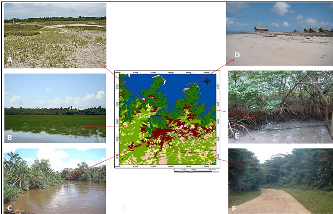
Figura 3 – Paisagens no município de Quatipuru, demonstrando que os estudos humanistas não compreendem o homem tangenciado da natureza física, mas este homem só é por meio dessa relação (sociedade-natureza), possuindo a paisagem como mediador.

mesmo Santos (2008; 2014). Embora não desconsideremos suas contribuições à análise geográfica sobre a dinâmica da paisagem. A presente pesquisa é uma tentativa de unir o caráter humanista – a partir da abordagem fenomenológica – e as paisagens (Figura 3) do ecossistema estuarino como uma proposta geográfica que considere a complexidade do real, a “complexidade” como nos ensina Morin (2015).