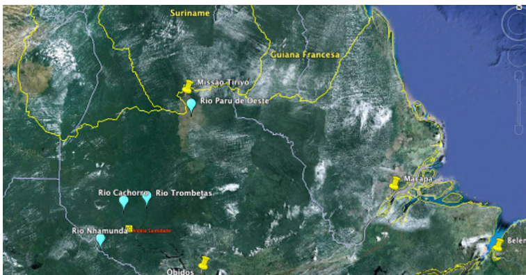
Principais rios e lugares citados no texto, inseridos no contexto das Guianas.

destes últimos morreu. Os restantes, por necessidade, ligaram-se novamente aos índios do rio Kaxúru que, outrossim, também foram dizimados por doenças. Em relação aos adultos, o número dos jovens estava em certa desproporção de excedentes, mas – e aí começa novamente o grande problema para os Kaxúyana – todos estavam aparentados entre si que, para a maioria dos jovens não havia mais possibilidade de casamento dentro das leis tribais do parentesco, etc. É, pois, natural que surgia a idéia de ligar-se, novamente, a algum grupo para assegurar a sobrevivência. Sob o ponto de vista Kaxúyana havia somente duas possibilidades: uma era descer o rio Trombetas para a região da Porteira, morar no meio da população negra e mesclar-se com ela. Mas isto não lhes agradava. Tinham ainda bastante consciência tribal de querer ser e continuar “gente”, isto é, índio. Outra era a de se agregar a um dos grupos dos altos rios. Visto que os Ingarume, seus parentes, tinham abandonado o Panamá, como bem sabiam, só lhes restava escolher um dos grupos mais afastados. Excluíram de antemão os Tunayâna/Xarúma, portanto a região do [rio] Turúnu. Experiências antigas tinham mostrado que não se davam muito bem com eles, embora não houvesse inimizade. As opiniões variavam entre os Hixkaruyána do Nhamundá e os Tiriyó do alto Paru de Oeste. Realmente, uns poucos (duas famílias, se estamos bem informados, num total de 6 ou 7 pessoas) foram ao Nhamundá e agregaram-se lá à Missão do