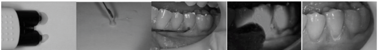
Figura 2 – Proporcionamento do material (1 click), manipulação (fio), inserção, fotopolimerização do material e caso clínico concluído.