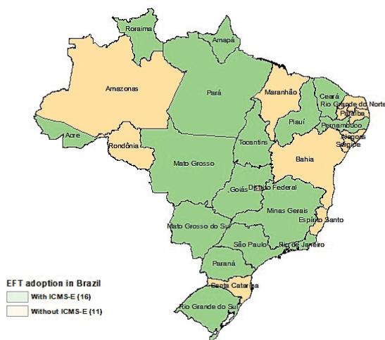
Figura 2 - Distribuição espacial da adoção de TFE

Mato Grosso do Sul, Minas Gerais, Amapá, Rondônia, Rio Grande do Sul, Pernambuco, Mato Grosso, Tocantins, Acre, Ceará, Rio de Janeiro, Piauí, Goiás, Paraíba, e Paraná criaram legislações para adotar também esquemas de TFE. Contudo, o estado da Paraíba ainda não implementou efetivamente as TFE em seu território devido a uma decisão proveniente de uma ação direta de inconstitucionalidade movida pelo governo estadual, que entendeu que havia incompatibilidade do esquema proposto com aquilo que reza a Constituição Federal. Dessa forma, existem efetivamente apenas dezesseis estados, entre os vinte e seis, com um esquema de TFE em andamento. A Figura 2 apresenta o atual estágio da distribuição espacial da adoção desse instrumento entre os estados.