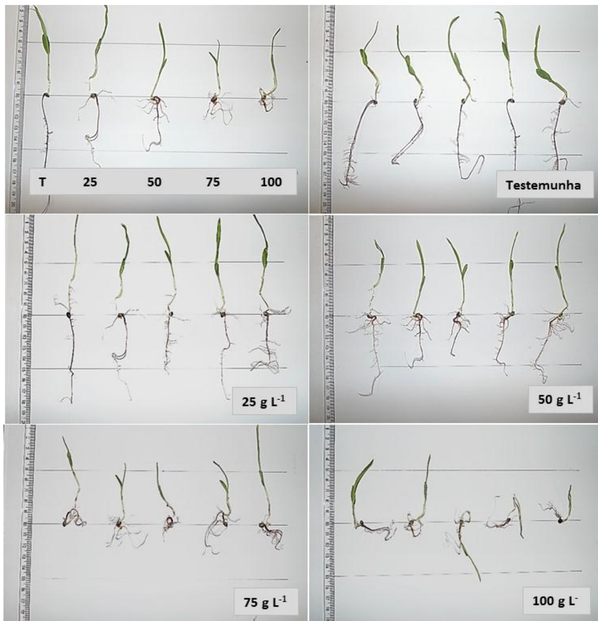
Figura 3. Plântulas de sorgo sacarino oriundas de testes de germinação utilizando diferentes concentrações do extrato aquoso de restos vegetais de Pityrocarpa moniliformis . Sweet sorghum seedlings from the germination tests using different concentrations of the aqueous extract with plant remains of Pityrocarpa moniliformis.

A posição das parcelas experimentais (rolos de papel verticalmente posicionados) dentro das câmaras de germinação possibilita o crescimento regular das plântulas como evidenciado pelas parcelas testemunhas, descartando fatores externos de interação a não ser pela ação efetiva do extrato (fonte única de variação). Esta alteração ao nível de tropismo pode ser explicada em parte pelas interações do(s) aleloquímico(s) presente(s) no extrato de P. miniliformis com os reguladores (hormônios) nas células meristemáticas das plântulas de sorgo, interação esta mencionada anteriormente. Este caso sugere relação com a auxina, visto que este regulador está associado ao crescimento vegetal como um todo e sua sinalização funciona praticamente em todos os aspectos do desenvolvimento, incluindo o fenômeno do