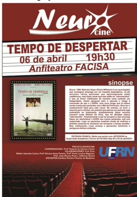
Figura 1. Cartaz de divulgação do filme a ser exibido pelo projeto.

As sessões eram limitadas ao número de lugares disponíveis no anfiteatro (50 lugares) a fim de permitir conforto e acomodação necessária a todos os participantes para