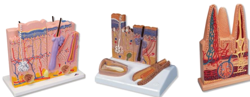
Figura 3. Algumas das peças anatômicas utilizadas no módulo 01

Especificamente para esses encontros, foram utilizados modelos anatômicos sintéticos representativos da epiderme, derme e hipoderme, dividindo as mesmas em suas diferentes camadas: córnea, granulosa, espinhosa e basal, compreendidas como epiderme; e papilar e reticular, como derme (Figura 3). Também foram utilizadas imagens e lâminas histológicas para melhor visualização e compreensão das características da organização celular, vascular e de inervação das diferentes camadas da pele, das glândulas sebáceas e sudoríparas, e do folículo piloso. Posteriormente, foram discutidos os conceitos e características das feridas e do processo de cicatrização.