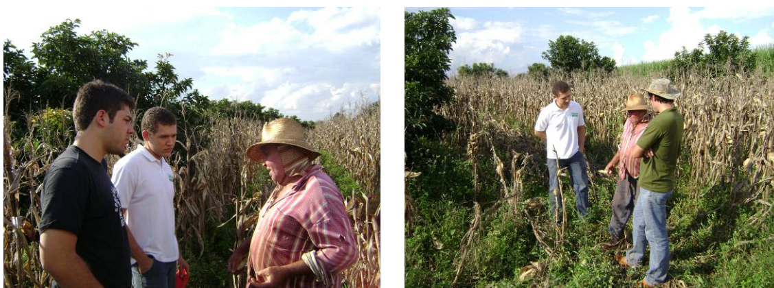
Figura 2. Discentes do curso de Engenharia Agrônoma do CCA/UFSCar com produtor rural do núcleo São Bento, Araras-SP: compartilhamento de experiências.

O levantamento feito neste estudo foi previamente divulgado para a comunidade do CCA/UFSCar e despertou o interesse dos alunos que compõem o GEPAGRI (Grupo de Estudos e Pesquisa em Agricultura), formado por 25 graduandos do curso de Engenharia Agrônoma e que desempenha atividades de campo visando ao aprimoramento da formação profissional. A ausência de assistência técnica, a diversidade de culturas conduzidas no núcleo de São Bento e a consciência de que a informação gerada na Universidade precisa alcançar esses produtores foram alguns dos motivos para que o GEPAGRI se organizasse de forma que cada propriedade tem sido visitada, quinzenalmente, por dois alunos (Figura 2).