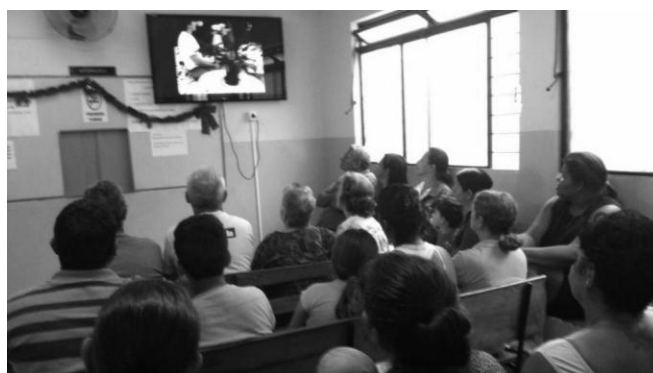
Figura 1. Exibição de vídeos educativos na Unidade de Saúde do bairro Itai em Divinópolis.

Os vídeos foram exibidos em televisores de LCD de 40 polegadas afixados na parede para aproximadamente 150 pessoas que aguardavam nas salas de espera (Figura 1). Os vídeos foram a melhor forma que os membros do projeto encontraram para atrair a atenção dos adultos e idosos nas UBS.