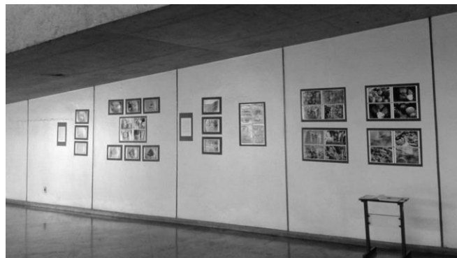
Figura 2. Montagem da mostra fotográfica "Restos e descuidos" no Terminal Rodoviário em Divinópolis.

Associado ao trabalho educativo, foram trabalhadas imagens captadas de moradores de rua em meio ao lixo, de descarte inadequado de resíduos, de vetores de doenças em locais indevidos, dentre outras. Todas as imagens trabalhadas apresentaram cidadãos sem o aparecimento dos rostos evitando identificação. A partir dessas imagens foram realizadas seis exposições em locais públicos de Divinópolis, onde foram colhidas mais de 160 assinaturas no caderno de presença de três destas. Realizou-se três apresentações da mostra intitulada - "Restos e descuidos" e quatro da mostra "O que você vê daquilo que olha". As fotos da primeira foram colocadas numa escola estadual, no Terminal Rodoviário e na Superintendência Regional de Saúde de Minas Gerais, todos localizados no município de Divinópolis (Figura 2). Já as fotos da segunda, foram expostas no hall de entrada do CCO/UFSJ, na Superintendência Regional de Saúde de Minas Gerais, na biblioteca pública e numa instituição de ensino superior de Divinópolis (Figura 3).