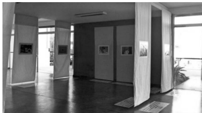
Figura 3. Mostra fotográfica "O que você vê daquilo que olha" no hall de entrada do CCO/UFSJ.

Assim, as exposições fotográficas tiveram a intenção de informar a população e envolver ainda mais a equipe sobre a temática para ampliar as formas de abordagem à população. Essa foi uma estratégia, para salientar situações que apesar de muitas vezes