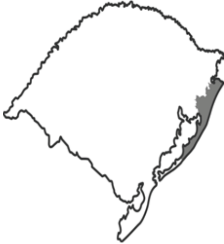
Figura 1 - Mapa do Rio Grande do Sul