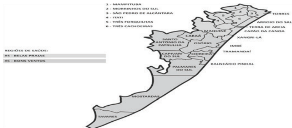
Figura 2 - Mapa da Microrregião de Osório