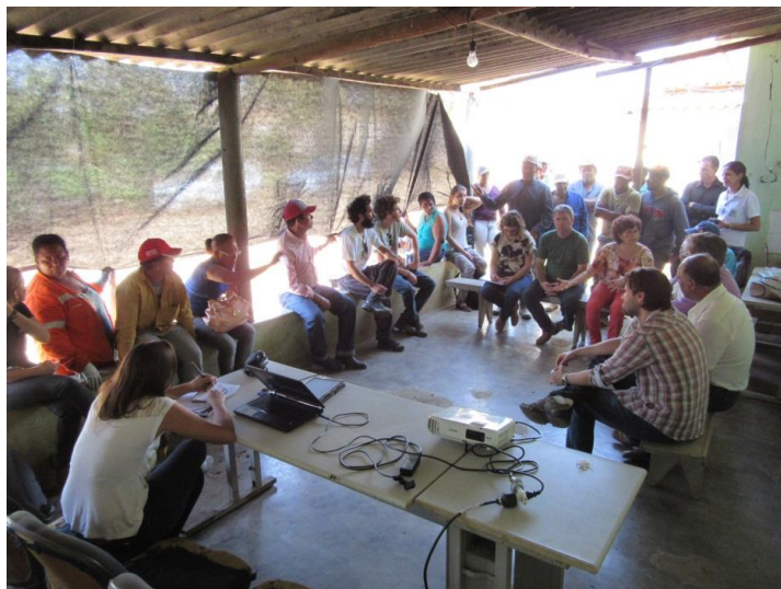
Figura 1. Primeira reunião junto aos produtores para a implementação do modelo CSA