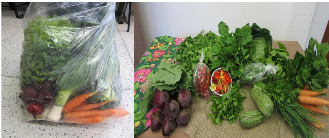
Figura 2. O formato da cesta e alguns dos produtos que a compõem