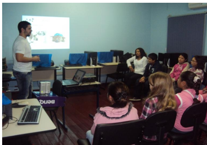
Figura 1. Documentação fotográfica de palestra do projeto “Melhor Amigo”, realizada por acadêmico do curso de medicina veterinária da UNIPAMPA (em pé) na Escola E. E. E. F. Flores da Cunha para adolescentes de 13 a 16 anos (sentados), no município de Uruguaiana-RS, realizada em junho de 2012.

Aplicaram-se questionários objetivos antes e após as ações do projeto “Melhor Amigo” inquirindo-se sobre questões relacionadas ao bem-estar animal, prevenção de zoonoses e controle populacional de animais. Os resultados foram contabilizados e avaliados pelo teste das Proporções, com 95% de confiabilidade, para se verificar a eficácia do método sobre o público alvo.