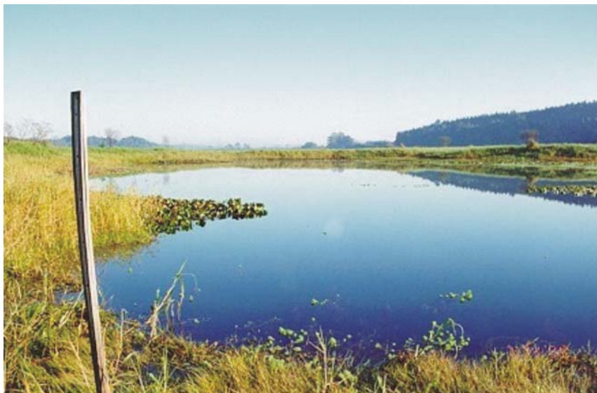
Figura 1. Visão panorâmica da lagoa marginal, no trecho de desembocadura do rio Paranapanema (Represa de Jurumirim).

sugestões de atividades que podem ser desenvolvidas com alunos do ensino fundamental e população em geral.