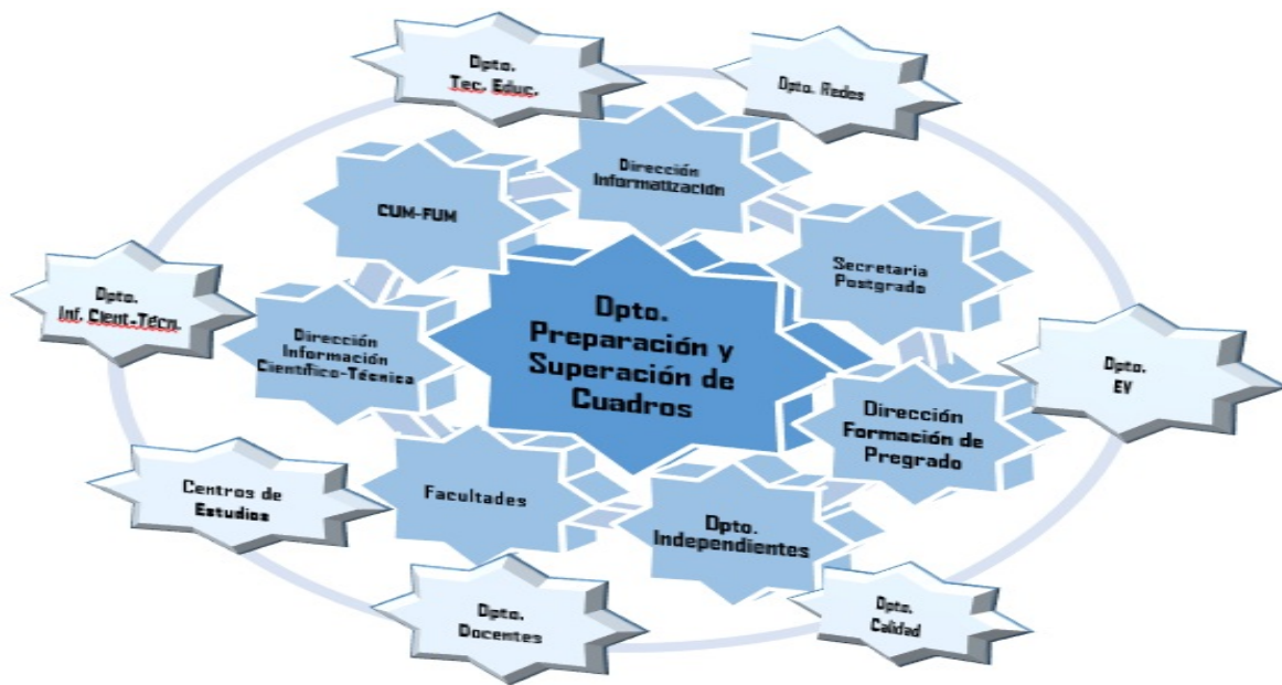
Figura no. 1. Modelo organizacional de educación de postgrado a distancia mediada por las tecnologías.

programas de formación profesional y académica que se ofrecen como parte de la formación permanente, la composición del claustro de Educación de Postgrado y las posibilidades que tienen las tecnologías para crear ambientes de aprendizaje que apoyan la autogestión del aprendizaje y que facilitan la interacción y la interactividad de los participantes son condiciones favorables para desarrollar la Educación de postgrado a distancia mediada por las tecnologías. Sobre la base de la estructura de la Universidad de Granma (Ministerio de Educación Superior, 2017) las unidades organizativas perteneciente al área del Vicerrector Primero se encuentra la Dirección de Informatización y formando parte de ella, el Departamento de Redes y de Tecnología Educativa; en el área del Vicerrector de Formación de Pregrado, está la Dirección de Formación de Pregrado, en la cual se encuentra el Departamento de Educación Virtual; en el área de la Vicerrectoría de Investigación y Postgrado, se establece como independiente el Departamento de Preparación y Superación de Cuadros y el Departamento de Calidad, y en la Secretaria General, se crea la Secretaria de Postgrado, así como la Dirección de Información Científico-Técnica, donde se encuentra el Departamento de Información Científico-Técnica; además de seis Facultades, diez Centros Universitario Municipal y una Filial Universitaria Municipal. (Figura No. 1).