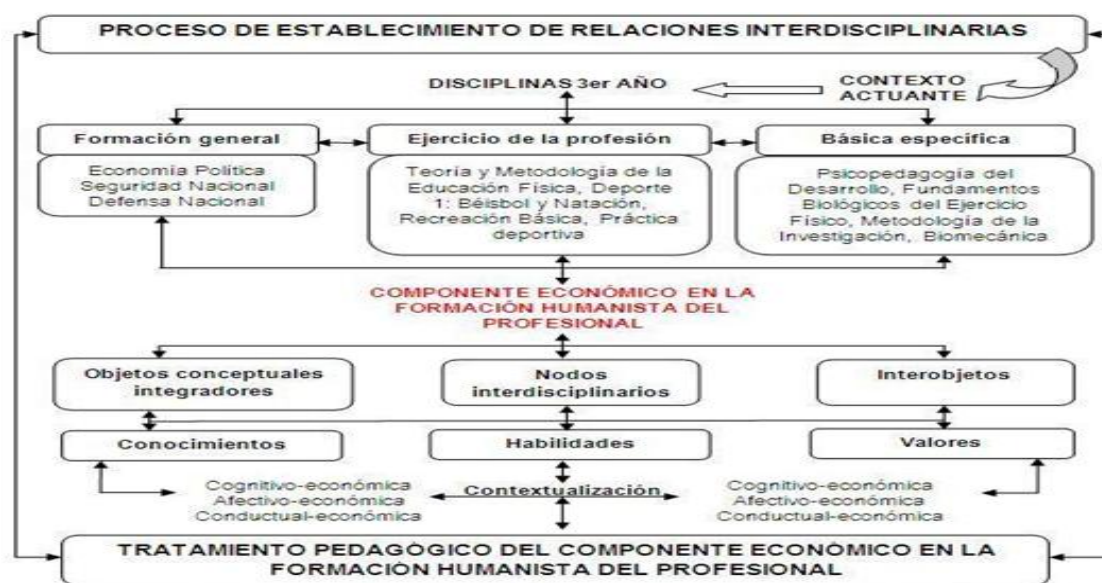
Figura 1. Lógica interdisciplinaria para el tratamiento pedagógico del componente económico en la formación humanista del profesional de la Cultura Física

Partiendo de los sustentos asumidos para el establecimiento de relaciones interdisciplinarias, se requiere de un estudio en el año, del objetivo al que tributan las disciplinas. Luego determinar, a partir de un abordaje pedagógico, los objetos conceptuales integradores, interobjetos de las disciplinas y cómo operar desde los contenidos:(conocimientos, habilidades y valores), como nodos interdisciplinarios que permiten el tratamiento del componente económico para potenciar la formación humanista.