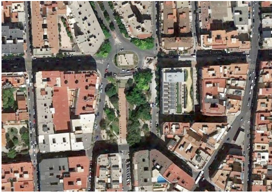
Figuras 1 y 2: Vista aérea y entorno urbano de la plaza de América y edificio de viviendas intergeneracionales