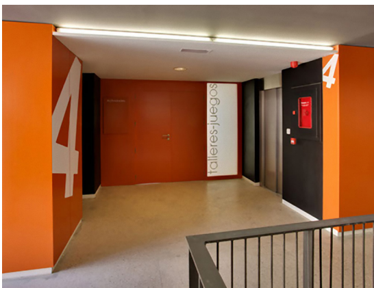
Figura 5: Vista interior de los espacios colectivos del edificio intergeneracional.