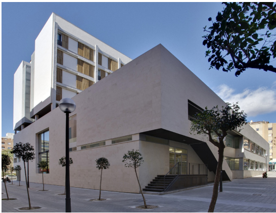
Figura 3: Perspectiva ángulo sureste del edificio intergeneracional. El volumen de las dos primeras plantas se destina para los servicios públicos.