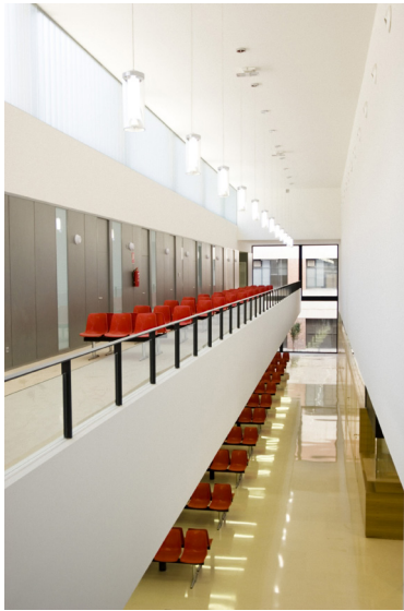
Figuras 13 y 14: Planta baja y primera en las que se sitúan los servicios asistenciales públicos y detalle de hueco de iluminación común a doble altura en la fachada norte.