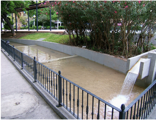
Figuras 18 y 19: Detalle de la fuente y juego de cascadas.