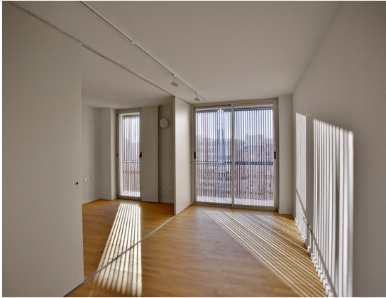
Figuras 10 y 11: Imagen interior de una de las viviendas hacia el este y detalle fachada oeste desde la plaza.