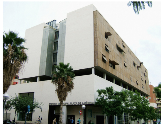
Figura 4: Perspectiva ángulo noroeste del edificio intergeneracional. Las cuatro plantas de los volúmenes superiores son las destinadas a las viviendas.