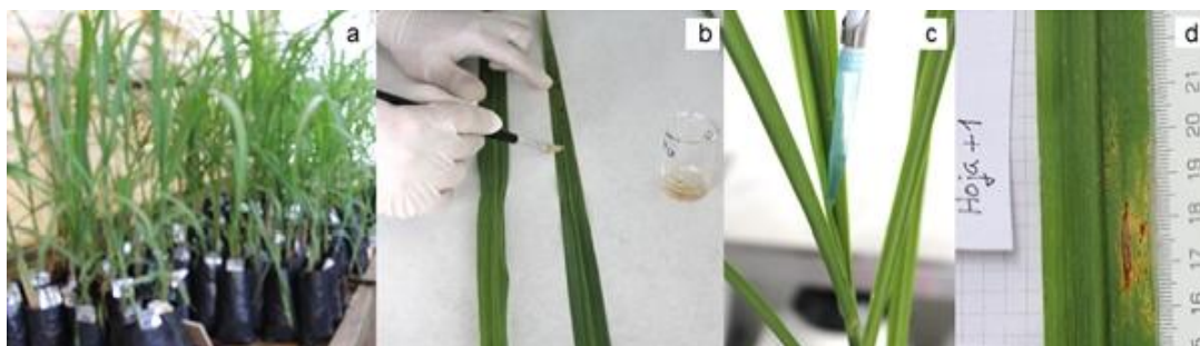
Figura 1. Diferentes etapas del protocolo de selección de cultivares de caña de azúcar. a) plantas adaptadas a las condiciones del cuarto de inoculación, b) colecta de uredosporas de P. kuehni , c) inoculación, d) evaluación de la respuesta de caña de azúcar a P. kuehni .

una regla milimetrada (Figura 1d). Luego las imágenes se procesan a través del programa de análisis y procesamiento de imágenes ImageJ 1.43u (Abramoff et al. , 2004; Ferreira y Rasband, 2012) u otro con similares funciones que permitan el conteo de las pústulas y sus dimensiones.