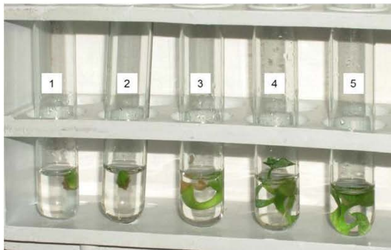
Figura 3. Características morfológicas de los explantes de malanga en cada uno de los medios de cultivo evaluados a los 29 días de cultivo. Tratamientos: 1. Sales y vitaminas MS + 0.1 mg l -1 de 6-BAP (Control), 2. Sales y vitaminas MS; 3. Sales y vitaminas MS + 0.3 mg l -1 de 6-BAP; 4. Sales y vitaminas MS + 0.5 mg l -1 de 6-BAP; 5. Sales y vitaminas MS + 1.0 mg l -1 de 6-BAP.

En cultivo in vitro de los ápices de malanga se han empleado concentraciones de 6-BAP en el medio de cultivo de establecimiento que varía desde 0.1 hasta 2.0 mg l -1 (Dotin, 2000; Rodríguez et al. , 2009). Sin embargo, autores como Huang et al. (2007) usaron para el establecimiento de cultivares de Colocasia esculenta var. esculenta