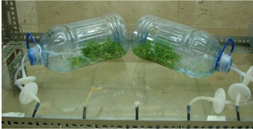
Figura 2. Multiplicación de explantes de malanga 'INIVIT MC-2001' en sistema de inmersión constante con aireación al medio de cultivo.

En el cultivo de malanga, Santos et al. (2011) desarrollaron una metodología para la multiplicación en SIT del clon de malanga Xanthosoma 'Viequera'. Estos autores, con el empleo de frascos de 250 ml, 14 minutos de inmersión cada seis horas, ocho brotes por frasco, 15 ml de medio de cultivo por brote y un tiempo de cultivo de 18 días obtuvieron la mejor respuesta del material vegetal y el mayor coeficiente de multiplicación (10.40). Sin embargo, escasos trabajos se han desarrollado con la utilización del sistema de inmersión continua con aireación al medio de cultivo, el cual resultó ser eficiente para la multiplicación del clon de malanga 'INIVIT MC-2001'. Este tipo de sistema de cultivo, por su bajo costo y facilidad de instalación para su puesta en funcionamiento, resulta más económico, en comparación con el SIT y su aplicación y generalización son factibles para incrementar la multiplicación de explantes de malanga. Al mismo tiempo, al ser un sistema que utiliza frascos desechables facilita el manejo de los explantes hacia las Biofábricas con un riesgo mínimo de pérdidas por contaminación microbiana y permite el traslado de gran número de explantes en menor espacio, lo que humaniza el trabajo y evita el engorroso manejo de la cristalería.