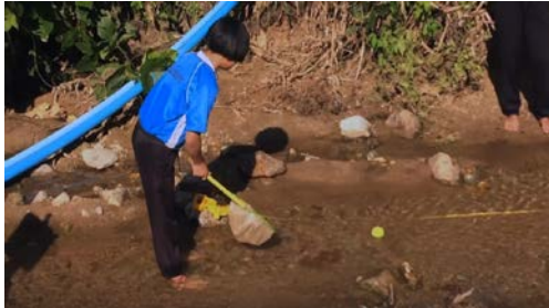
ภาพที่ 3 การทดลองการวัดการระบายน้ำ

ส่วนที่ 2: การหาค่าเฉลี่ยพื้นที่หน้าตัดแม่น้ำ