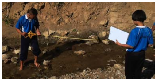
ภาพที่ 4 การสำรวจก้อนหินท้องน้ำ

3) ในแหล่งน้ำที่มีหิน ทราย หรือกรวดขนาดเล็ก ๆ มาตั้งแต่ต้นน้ำนั้น เป็นผลมาจากการชะล้างพังทลายของหน้าดิน