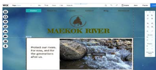
ภาพที่ 8 การออกแบบเว็บไซต์โดยใช้อุปกรณ์ของ wix

ให้ผู้ใช้เข้าไปใช้งานอยู่แล้ว ผู้ใช้จึงทำแค่เพียงนำ ข้อมูล รูปภาพ ไฟล์วิดีโอ และเอกสารต่าง ๆ มา ใส่ตามที่ได้ออกแบบไว้ ซึ่งผู้พัฒนาจะต้องทำการ ปรับเปลี่ยนหน้าจอการแสดงผลให้รองรับกับอุปกรณ์ทั้งคอมพิวเตอร์ที่มีหน้าจอขนาดใหญ่และ สมาร์ทโฟนที่มีหน้าจอขนาดเล็ก ดังในภาพที่ 8