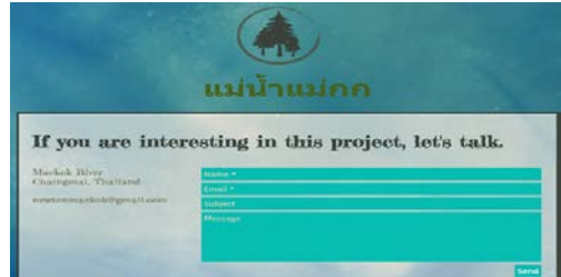
ภาพที่ 7 หน้าที่ใช้ในการติดต่อทีมงาน

กล่องส่งข้อความที่ผู้ใช้จะสามารถถามคำถามและรับคำตอบกลับจากทางทีมงานผ่านอีเมลที่ได้ให้ไว้ ดังในภาพที่ 7