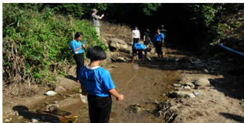
ภาพที่ 5 การถ่ายทำการทดลองเกี่ยวกับแม่น้ำ

ในการสร้างเว็บไซต์เพื่อเอาไว้เป็นสื่อการเรียนการสอนและให้ผู้สนใจเข้ามาศึกษาหา