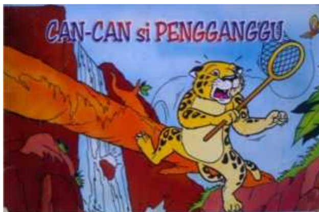
Gambar 1. Sampul buku cerita anak berjudul Can-Can si Pengganggu

atau akal sehat. Cerita robotik beresiko “merusak otak” atau cara berpikir anak karena redaksinya cenderung negatif, menonjolkan tokoh cerita yang berakhlak tercela, mengandung unsur mistik bahkan sek. Unsur cerita yang demikianlah yang mengakibatkan otak anak pada sistem limbik (khususnya amigdala) menjadi tidak berfungsi dengan baik karena bekerja di bawah tekanan dan ketakutan yang mencekam. 18 Penelitian-penelitian mutakhir, terutama yang dilakukan oleh Kuswaya, dkk, 19 Nurdin Nurdin & Muhammad Nur Ahsan 20 serta Mulya Haryani R 21 menunjukkan bahwa anak dan remaja yang terlalu sering menonton atau mendengar tayangan maupun berita pornografi dapat beresiko pada kerusakan otak. Dengan demikian, cerita dengan rekdis buruk (mistik, seks, dan lain-lain)—meskipun isinya baik—dapat beresiko merusak otak anak, baik kerusakan psikologis maupun neurobiologis. Sekadar contoh, cerita anak berjudul “Can-Can si Pengganggu” sebagaimana gambar 1 berikut ini: