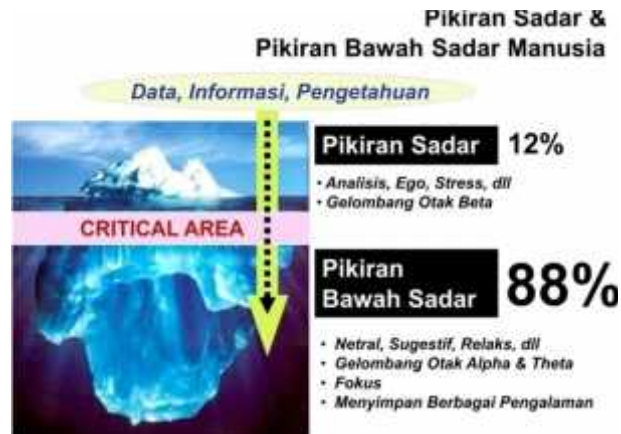
Gambar 3. Metafor teori gunung ES. Teori Gunung Es dalam menjelaskan kekuatan pikiran sadar dan bawah sadar. Dalam konteks ini, cerita anak juga ditangkap anak dengan dua kekuatan pada otaknya yakni sadar dan bawah sadar. Walaupun pikiran sadar menangkap pesan moral yang positif dalam sebuah cerita, namun jika cerita tersebut dominan redaksi negatifnya, maka pesan negatif itulah yang akan masuk dalam alam bawah sadar anak.

Gambar 3 di atas menjelaskan bahwa kekuatan pikiran sadar sebesar 12% sedangkan pikiran bawah sadar sebesar 88%. Sebagaimana disebutkan Piaget bahwa pikiran sadar anak usia dini belum optimal, sehingga yang dominan bekerja adalah pikiran emosional atau pikiran bawah sadarnya. Jika cerita yang disampaikan kepada anak lebih banyak muatan negatifnya, sedangkan muatan negatif tersebut bernada emosional, maka pesan-pesan negatif itulah yang akan masuk ke alam bawah sadar anak. Ketika pesan negatif ini masuk, maka 88% mindset nya akan menjadi negatif, termasuk negatif dalam hal cara berpikir, karakter, watak, sikap, kepribadian, dan lain sebagainya.