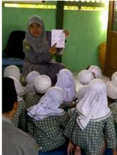
Gambar 4. Story reading , seorang guru PAUD sedang membacakan cerita bergambar kepada anak-anak.

Robert Fisher. 28 Di berbagai lembaga PAUD di Yogyakarta, story reading lebih diunggulkan dari storytelling . Sebab, banyak lembaga PAUD yang memandang bahwa story reading mempunyai implikasi lebih signifikan terhadap peningkatan penguasaan literasi, khususnya baca-tulis sejak dini. Oleh karena itu, guru-guru pada PAUD lebih banyak memberikan story reading daripada storytelling . Sekadar contoh, seorang guru RA Masyithah Karanganom Yogyakarta sedang mengajar dengan menggunakan metode story reading . Lihat gambar 4 berikut ini: