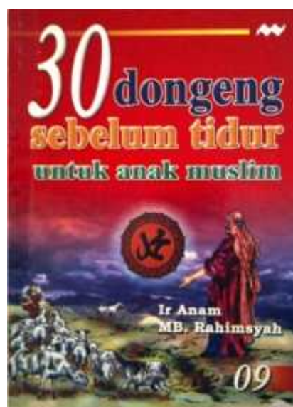
Gambar 2b sampul buku kumpulan kisah Nabawi(CBM Creative Agency, 2017)

Buku cerita yang sejenis dengan buku di atas masih banyak jumlahnya, dan buku-buku semacam itu banyak dijumpai di rak-rak perpustakaan PAUD. Artinya, buku-buku tersebut menjadi panduan para guru PAUD untuk cerita di depan anak didik mereka. Sebagaimana disebutkan di atas bahwa cerita-cerita mereka lebih bernuansa nerakawi daripada surgawi. Judul-judul cerita di dalam buku di atas diantaranya adalah, “Pembunuhan Pertama”, “Kaum Penyembah Berhala”, “Kaum ‘Ad yang Sombong”, “Perkawinan Sesama Jenis”, “Datangnya Hukuman”, dan lain sebagainya. Membaca judul-judul cerita ini, tidak ada yang positif sama sekali. Oleh karena itu, meskipun isi cerita adalah baik, namun jika disampaikan dengan redaksi yang buruk, maka sisi-sisi keburukan itulah yang akan masuk ke dalam alam bawah sadar anak (pesan mental-emosional), karena alam sadar-rasionalnya belum tumbuh dengan baik. Sekadar contoh, ketika anak dilarang melakukan “A”, ia akan semakin penasaran dengan larangan tersebut. Sama halnya ketika orang dewasa dilarang membayangkan peristiwa tertentu—kisah percintaan, misalnya—maka otak orang dewasa justru membayangkan hal yang dilarang tersebut. Demikian pula dengan cerita-cerita di atas. Maksud cerita adalah baik (positif), namun disampaikan dengan redaksi negatif. Akibatnya, anak-anak lebih menangkap pesan mental-emosional yang sifatnya negatif dari pesan sadar-rasional yang sifatnya positif. Teori gunung es berikut ini dapat menjelaskan kerja pikiran sadar dan bawah sadar tersebut.