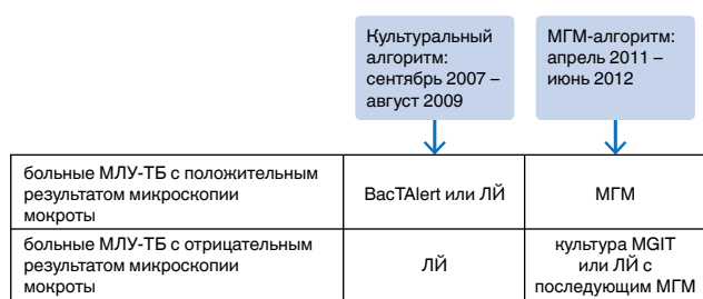
Рис. 2. Дизайн исследования. Когортное проспективное и ретроспективное исследование