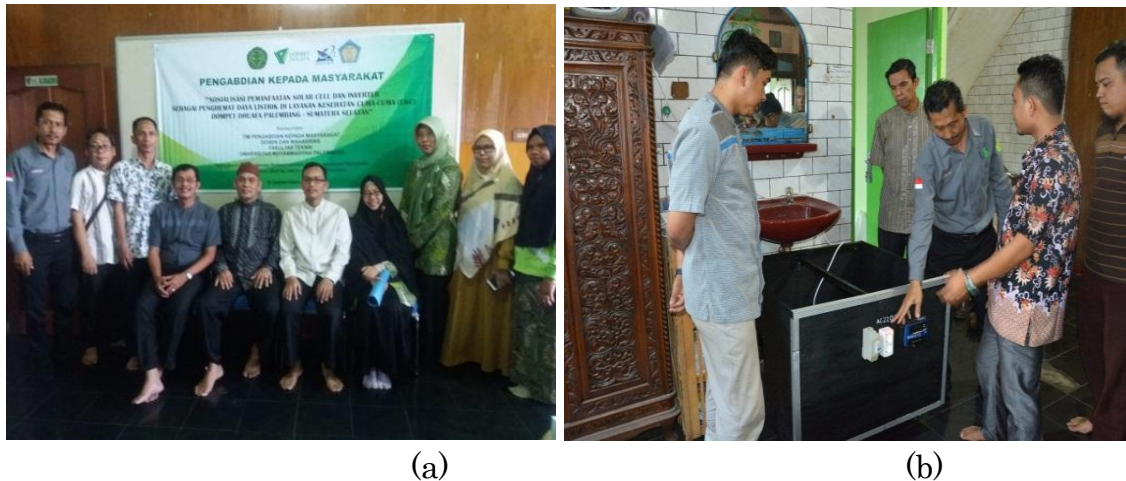
Gambar 3. (a) Kegiatan Sosialisasi dan instalasi alat inverter berbasis solar sel (b) Penjelasan pemakaian peralatan oleh narasumber.

berbasis listrik dengan lebih tepat dan efisien setelah sosialisasi dari tim PKM.