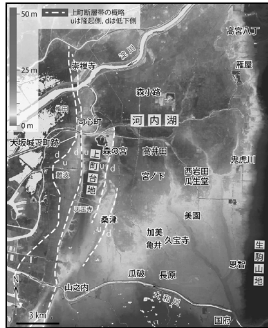
図 1 河内平野における約 2100 年前の主要な遺跡と上町断層帯 (杉戸 2016)

表層地質に関しては、既存ボーリングデータを入手して層相と層序、構造、年代に関する検討を行った。また、2017 年 6 月、名古屋市北区黒川本通二丁目において、沖積層最上部の把握のため、ボーリングコアを取得し (NAG-1~4・計 22 m 長)、観察と記載を行った。コアには旧流路地形と対応する湿地性堆積物および流路堆積物が認められ、計 2 点の放射性炭素年代値が得られた。今後くわしい編年を実現し、長波長の微細な断層変位地形の成立時期等を推定することが期待される。