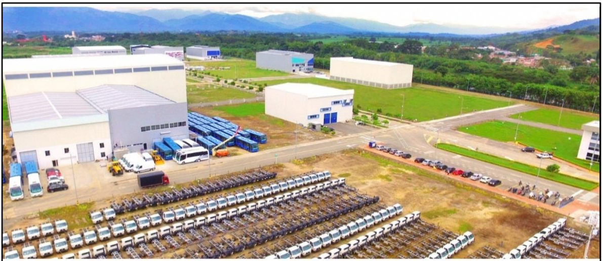
Ilustración 6: Zona franca de Pereira