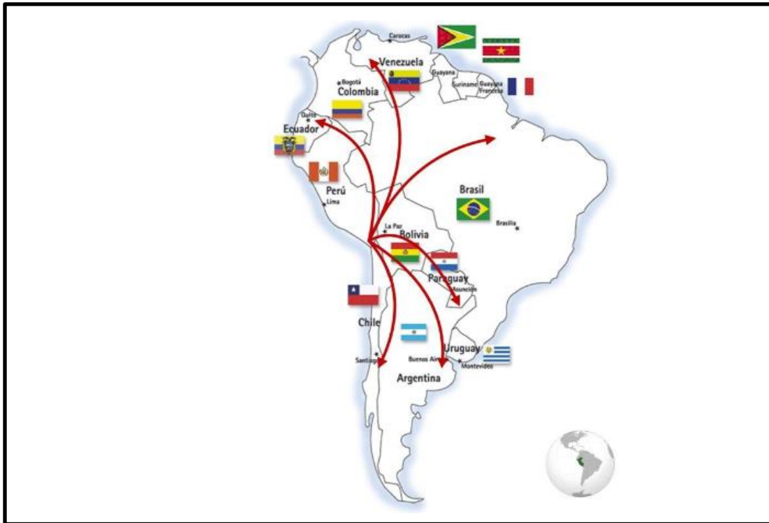
Ilustración 2 Operaciones que se realizan en ZOFRATACNA

reacondicionamiento de maquinarias, motores y equipos para la actividad minera; actividades de Call Center y desarrollo de software 23