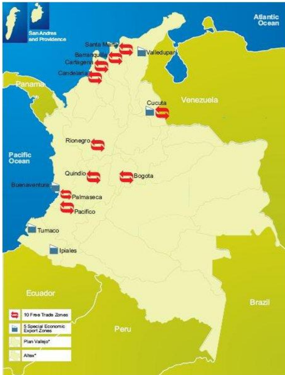
Ilustración 4 Zonas Francas en Colombia