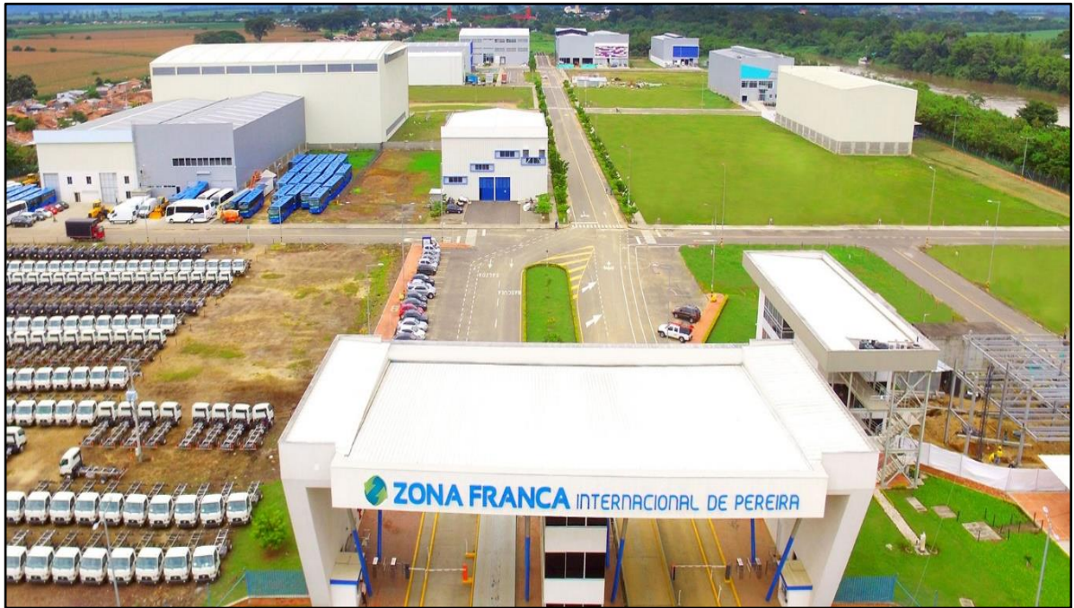
Ilustración 5: Zona franca de Pereira