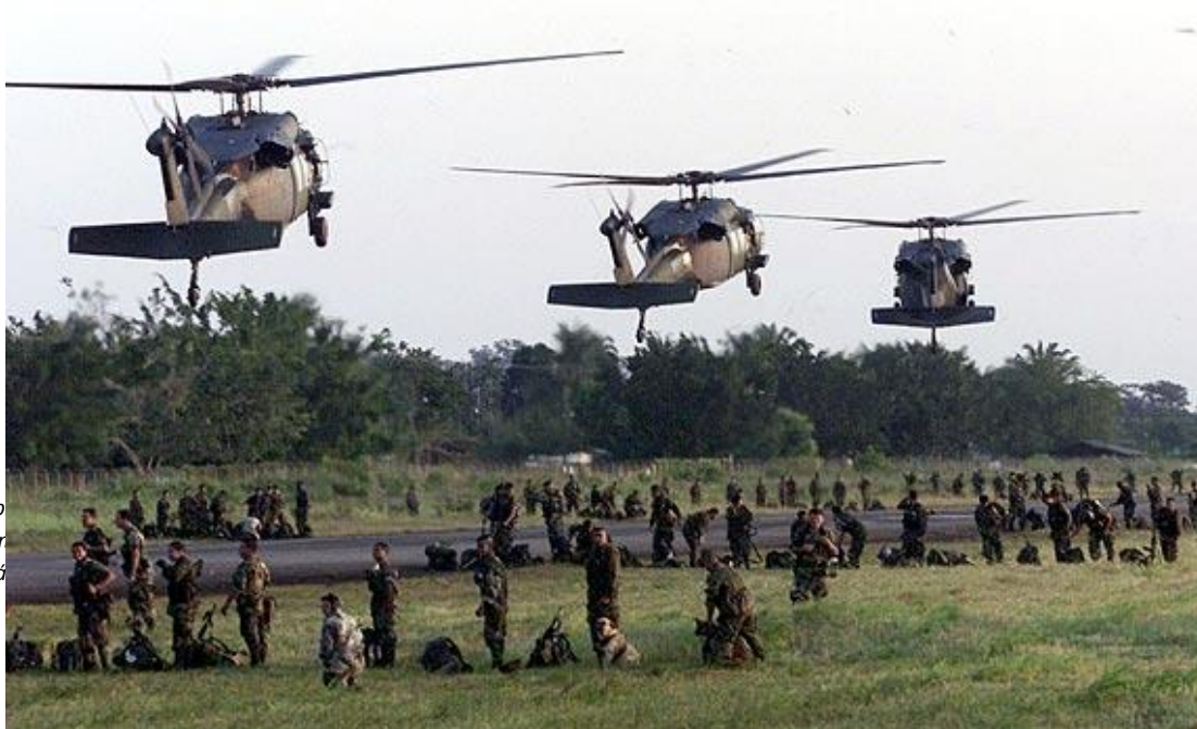
Figura No 4. Fuerza Pública en Combate

En vista al conflicto armado interno en el que vive Colombia se hace necesario que existan garantías para las fuerzas armadas legales colombianas, es decir, un fuero que les otorgue un status diferente frente a los demás ciudadanos, pero sin que éste sobrepase los estándares internacionales que protegen los Derechos Humanos y les concedan permisos para abusar del “poder” que tienen con el fuero castrense, puesto que se ha venido ya se han dado casos de abuso de la autoridad y de comisión de delitos graves por parte de las fuerzas armadas en contra, no sólo de los grupos armados ilegales, sino también de civiles inocentes, es ahí donde cabe preguntarse ¿si es necesario otorgarle más beneficios a los uniformados por medio de una reforma?