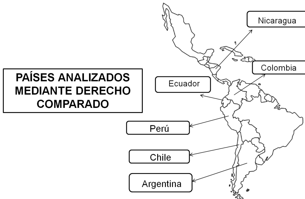
Figura No 3. El Fuero Militar en Derecho Comparado

Con esta exposición de derecho comparado se cierra este aparte, en el cual se puede concluir que el Fuero Militar es: Una investidura que se le otorga a los miembros de la Fuerza Pública y Policía, el cual brinda ciertos beneficios uno de ellos el ser juzgado solo en materia penal por jueces y tribunales especializados, conformados por miembros en servicio o en retiro de las Fuerzas Armadas del país y es un privilegio que solo opera cuando concurren los elementos Objetivos, subjetivos y funcionales del caso en concreto.