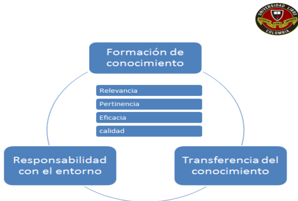
Grafico N°2. Objetivos de la Universidad Libre Siglo XXI

Sin embargo aterrizando el concepto a las instituciones universitarias, es fundamental entender que la internacionalización constituye una respuesta a la globalización que nace de “procesos continuos y comprehensivos” es decir abarcadores e integradores de todas las dependencias de la universidad y de toda la comunidad académica en general, llegando a cuestionar incluso la forma y la clase de enseñanza que impartimos y los métodos. En este escenario son fundamentales no solo las Estrategias propias del nivel organizacional, sino que deben generarse acciones e iniciativas que busquen impactar las actividades de naturaleza académica. Otra de las necesidades que tiene la Universidad en la construcción del conocimiento radica en la investigación. Tomada por el CNA como una de las exigencias fundamentales para los procesos de acreditación de programas e institucional, debe ser una prioridad para que el conocimiento sea transformado, seleccionado, reorganizado y garantice nexos con la práctica en un contexto determinado.