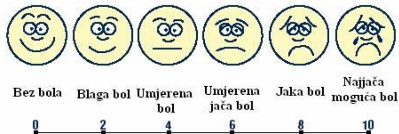
Skala za određivanje jačine bola

Prikupljanje podataka: Medicinska sestra prikuplja podatke o procjeni jačine boli skalom boli ( prilikom procjene jačine boli medicinska sestra može koristiti Vas skalu za procjenu boli). Medicinska sestra mora prikupiti podatke o lokalizaciji, trajanju, širenju i kvaliteti boli. Od velike važnosti je mjerenje vitalnih znakova čija promjena može odražavati postojanje boli [24].