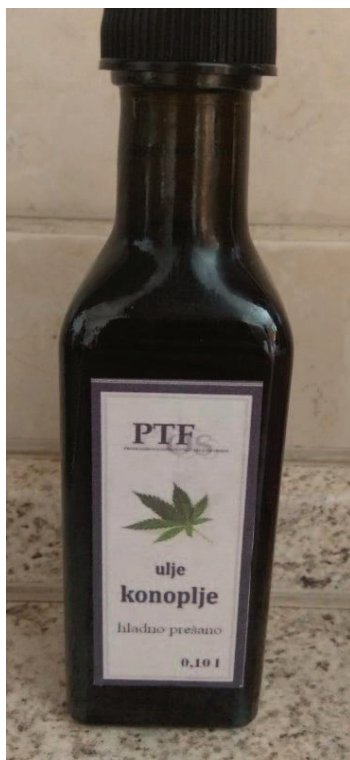
Slika 6. Finalni proizvod – hladno prešano konopljino ulje

Materijal koji se koristi štiti biljno ulje od vanjskih utjecaja. Nakon pripreme, odmjeravanja i razlijevanja, jestivo ulje se hermetički puni u čiste tamne staklene boce ili inoks spremnike i zatvara. Materijal mora biti inertan u odnosu na ulje i ne smije propuštati svjetlost. Zadnji korak u proizvodnji i pakiranju ulja jest etiketiranje i paletiziranje. Na etiketi se navodi naziv proizvoda, rok trajanja, datum proizvodnje i proizvođač te podaci o porijeklu i tehnološkom postupku. Boce se skladište u suhe, prozirne i tamnije prostorije, a predlaže se da se ulje ne skladišti zajedno s drugim namirnicama radi svoje sposobnosti navlačenja mirisa. Temperatura ulja mora biti između 12 i 20 °C, a vlažnost skladišta mora se kontrolirati, kao i održavanje stalne temperature od 3 do 5 °C da bi se izbjegle negativne promjene u ulju (Rac, 1964).