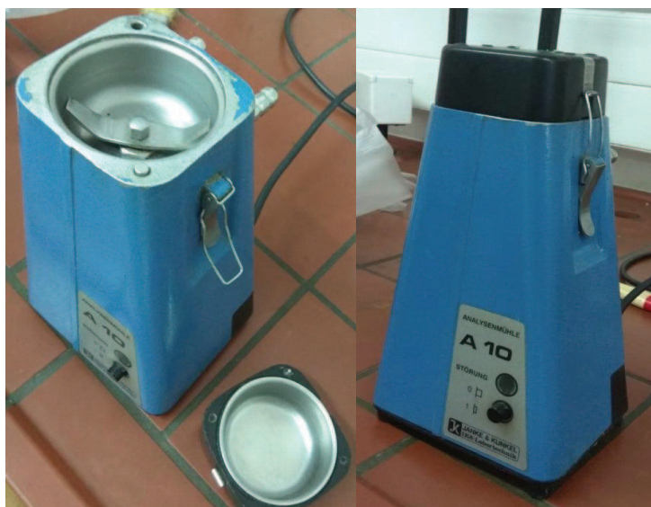
Slika 3. Laboratorijski uređaj za mljevenje

U svrhu pripreme materijala za prešanje ili ekstrakciju s otapalima te zbog povećanja iskorištenja ulja, vrši se mljevenje cijelog sjemena s ljuskom ili samo njegove jezgre. Mljevenjem se povećava površina sirovine iz koje izlazi ulje, smanji udaljenost od sredine do površine sjemenke te se dezintegracijom staničnog tkiva olakša izlazak ulja koje će se cijediti. Tijekom prerade mljevenje se može javiti više puta. Kod predprešanja mljevenje je grublje i pogodnije za velike stanice, tankih stjenki i struktura male čvrstoće. Drugo prešanje kao i jednokratno prešanje je finije i odgovara sitnim stanicama, jakih staničnih stjenki i čvrste strukture (laneno, sojino sjeme i kukuruzne klice). Bundevine koštice, arašidovo i pamukovo sjeme mogu se prešati i bez prethodnog mljevenja. Danas se najviše koriste mlinovi na valjke sa jednim, dva ili tri para valjka postavljenim jedno iznad ili pokraj drugog, a koriste se i mlinovi sa tri valjka (trovaljci) i pet valjaka (petovaljci). Promjer valjaka i veličina zubaca na površini mora biti usklađena s veličinom zrna, a valjci se redovito nazubljuju (Rac, 1964).