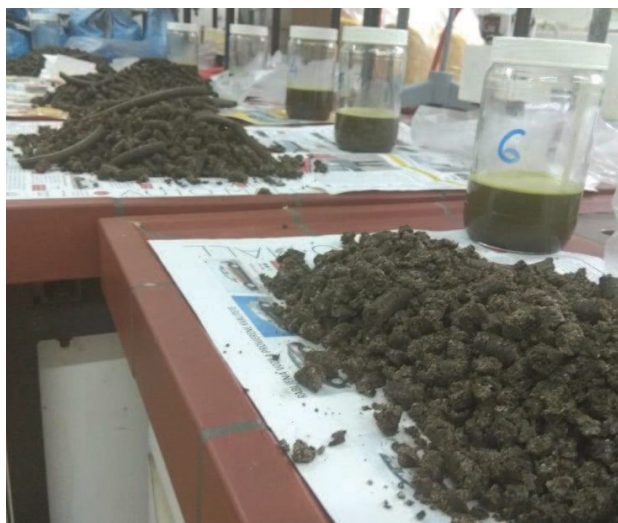
Slika 5. Proizvedeno sirovo ulje konoplje i nusprodukt pogača

Taloženje ili sedimentacija najjednostavniji je način odvajanja nečistoća iz sirovog ulja. Sirova ulja nakon prešanja prenose se u inoks rezervoare koji na raznim visinama imaju slavine za istakanje gornjih, izbistrenih slojeva ulja, također ih imaju na dnu, kroz koje ispuštaju istaložene čestice nečistoće. Djelovanjem gravitacije kroz određeni vremenski period, na dnu rezervoara talože se čestice nečistoće koje su teže od ulja. Nedostatak ovog postupka je slaba brzina taloženja, s obzirom da su čestice u ulju fine i mala je razlika u specifičnoj težini, a viskoznost ulja je velika. Drugi način odvajanja nečistoća iz sirovog ulja je filtracija. Tu se sirovo ulje propušta kroz filter na kojem zaostaju nečistoće, a ulje prolazi. Ova operacija ponavlja se nekoliko puta, a kao filter koriste se tkanine od pamuka, lana, vune i metalna tkiva. Izbor uređaja koji se koristi za filtraciju ovisi o vrsti taloga, stupnju onečišćenja sirovog ulja i potrebi finoće filtriranja. Za grubu filtraciju koriste se vibracijska sita i filtracijske centrifuge, dok se filter preše i centrifugalni separatori koriste za finije filtriranje. Nakon završenog procesa čišćenja sirovog ulja dobiven je finalni proizvod hladno prešano ulje (Rac, 1964).