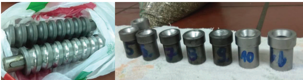
Slika 9. Pužnice pužne preše i nastavci različitog promjera za izlaz pogače

Mijenjajući veličinu otvora za izlaz pogače i frekvenciju elektromotora (brzinu pužnice) pri određenim temperaturama grijača glave preše kroz 10 uzoraka (pokusa) dobivene su različite količine sirovog ulja i nusproizvoda pogače.