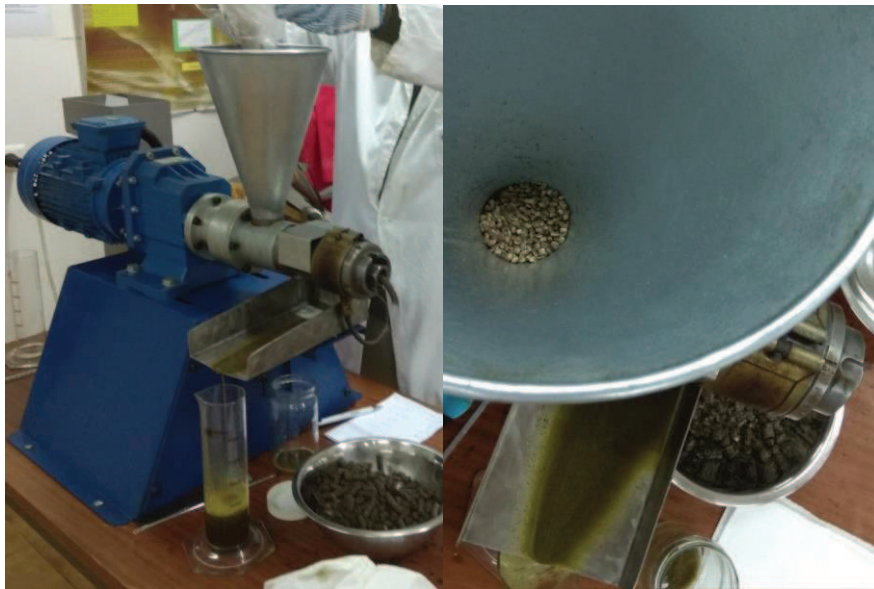
Slika 8. Pužna preša prilikom prešanja

Za proizvodnju hladno prešanog konopljinog ulja koristi se očišćena, osušena, neoljuštena i nesamljevena sjemenka konoplje. Postupak prešanja provodi se na laboratorijskoj kontinuiranoj pužnoj preši kapaciteta 20-25 kg/h i snage elektromotora 1,5 kW.