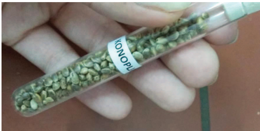
Slika 2. Konopljine sjemenke

Temeljem dozvole za uzgoj konoplje koju izdaje nadležno Ministarstvo dozvoljen je uzgoj konoplje pravnoj ili fizičkoj osobi koja nije osuđena za kazneno djelo zlouporabe droga unatrag pet godina i koja je upisana u Upisnik poljoprivrednih gospodarstava. Zahtjev se podnosi najkasnije do 31. svibnja tekuće godine, a koristi se isključivo kupljeno certificirano sjeme, a račun se čuva (Grgačević, 2019).