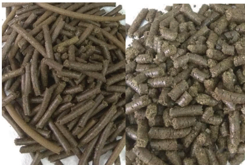
Slika 10. Usporedba pogača dobivenih pomoću nastavaka veličine 7 mm i 9 mm

Zatim se kroz deset dana provodi prirodna sedimentacija tj. taloženje proizvedenog sirovog ulja na tamnom mjestu, nakon čega slijedi vakuum filtracija, što se vidi na Slici 11. Ovim postupcima uklanjaju se netopljive nečistoće (sitne krute čestice iz sirovine) i povećava kvaliteta hladno prešanog konopljinog ulja kao finalnog proizvoda.