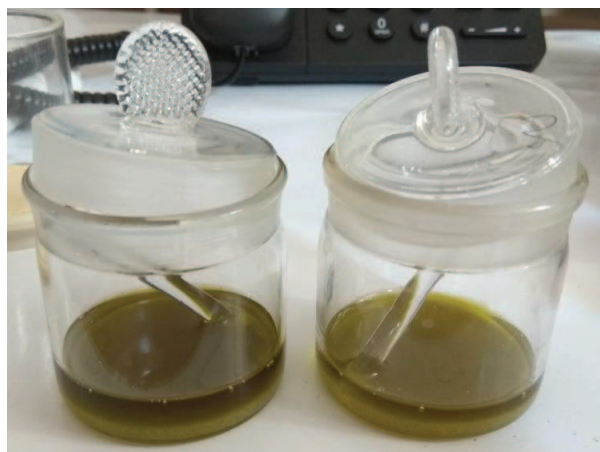
Slika 12. Uzorak sirovog ulja prije sušenja