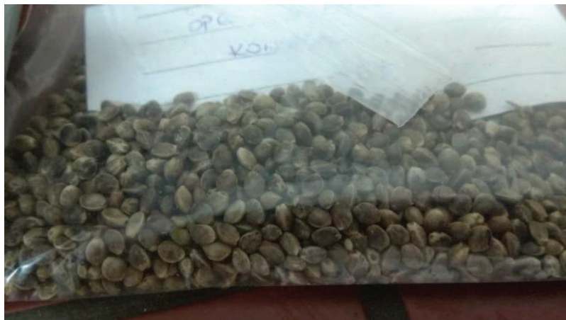
Slika 7. Sjemenke konoplje sorte Finola

Zadatak ovog rada je ispitivanje utjecaja procesnih parametara prešanja sjemenke konoplje na efikasnost proizvodnje i kvalitetu hladno prešanog ulja. Parametri prešanja koji se ispituju su veličina otvora za izlaz pogače, temperatura grijača glave preše i frekvencija elektromotora (brzina pužnice). Osnovni parametri kvalitete proizvedenog ulja: slobodne masne kiseline, peroksidni broj, udio vlage i udio netopljivih nečistoća određeni su primjenom standardnih metoda. Metodom po Soxhlet-u provedeno je određivanje udjela ulja u sjemenkama konoplje te udio zaostalog ulja u pogačama, iz čega se matematičkim putem izračuna efikasnost proizvodnje konopljinog ulja.