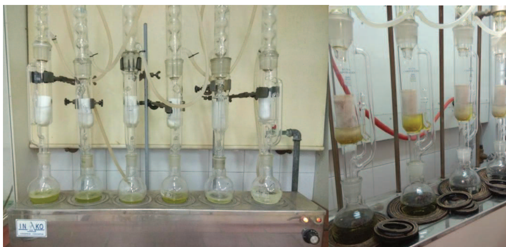
Slika 13. Aparatura za ekstrakciju ulja po Soxhlet-u