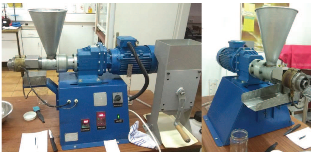
Slika 4. Laboratorijska pužna preša

Ekspeler ili pužna automatska preša javlja se 1905. godine u Americi, a radi na principu zagrijavanja, vlaženja ili sušenja sjemenja, nakon čega ga pužnica prenosi iz većeg u manji zatvoreni prostor, pri čemu nastaje visok tlak i cijedi se sirovo ulje, a kao nusprodukt izlazi pogača sa 12 – 15 % zaostalog ulja. Preše s jednom pužnicom su izdužene da bi materijal duže bio pod tlakom i prikladne su za manje kapacitete, s obzirom da se promjenom broja okretaja radne osovine koriste kao predpreše, završne preše pri dvostrukom prešanju, ali i za prešanje u jednom prolazu. Kapacitet preše ovisi o promjeru ulaznog dijela koša, punosti materijalom, hodu pužnice i brzini kretanja pužnice. Glavni element kontinuirane pužne preše je vodoravni puž navučen na glavnu radnu osovinu. Koš preše čine metalni štapići u obliku cijevi koji su uloženi u kućište, a trajanje izoštrenosti štapića ovisi o kvaliteti materijala, vrsti sjemenja i primijenjenom tlaku. U koš su ugrađeni i strugači noževi koji usmjere materijal prema izlazu. Neke preše su opremljene i uređajem za hlađenje koje sprječava prekomjerno zagrijavanje koša, te uređajima za doziranje materijala i regulaciju debljine pogače. Uzevši u obzir da temperatura ulja prilikom hladnog prešanja ne prelazi 50 °C, psihoaktivna komponenta THC kod konopljinog ulja ostaje u svom neaktivnom obliku (Rac, 1964).