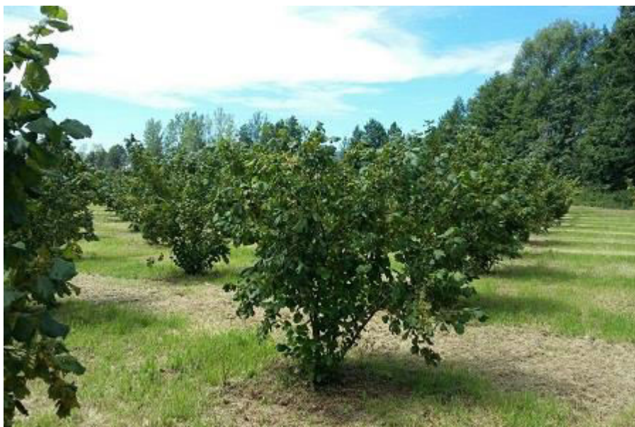
Slika 1. Uzgojni oblik grmolikog veza