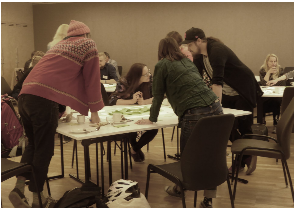
Kuva 4. Verstasryhmä keskustelun pyörteissä.

Museo tarjoaa asiantuntemuksensa avoimesti kaikkien käyttöön ja antaa kaikille mahdollisuuden tiedon jakamiseen, arvioimiseen ja kommentointiin. Samoista asioista kiinnostuneet löytävät toisensa museon virtuaalisessa oppimisympäristössä, mikä edistää oppimista ja kriittisesti arvioidun tiedon karttumista. Menneen, nykyisyyden ja tulevan erilaisiin tiloihin pääsee museon kautta tekemään opintomatkoja yksin tai yhdessä muiden kanssa. Yksi museon oppimisympäristön teemoista on Turun ja Suomen historia, johon pääsee tutustumaan muun maailman ja maailmankaikkeuden historian yhteydessä. Toinen temaattinen kokonaisuus on tulevaisuuden ja tulevaisuustietoisuuden oppiminen erilaisten menneisyyksien, nykyisyyksien ja tulevaisuuksien näkökulmien avulla.