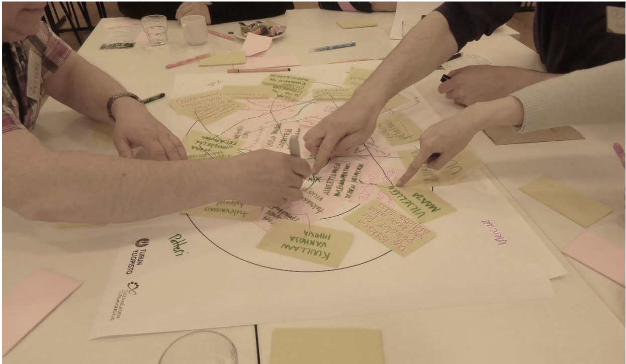
Kuva 3. Verstastyöskentelyä.

Kokoelmatyöhön pohdittiin erilaisia uusia toimintamuotoja. Nykydokumentointi tarinoiden tallentamiseen tunnistettiin kokoelmatyön osaksi. Ajateltiin, että esineitä voisi kokoelmista lainata tai niitä voisi tulostaa 3D-tulostimella, tulevaisuudessa ehkä 10D-tulostimella. Ruoan tulostaminen oli yksi esitetty museo-palvelu. Esimerkiksi ehdotettiin kivikauden tyyllisen mammuttiaterian tulostamista ja nauttimista. Esineiden virtuaalisen kokemisen palvelua pohdittiin eri aikakausien virtuaaliasujen muodossa. Lainaamisen, tulostamisen, virtuaalisen kierrättämisen ja syömisen kautta museokokoelmia hahmotettiin materian ja tarinoiden kiertotaloutena. Toisaalta mietittiin asiantijoiden yhteistyöverkostojen hyödyntämistä kokoelmatyössä ja kokoelmien kartuttamisen ja hoitamisen joukkoistamista.