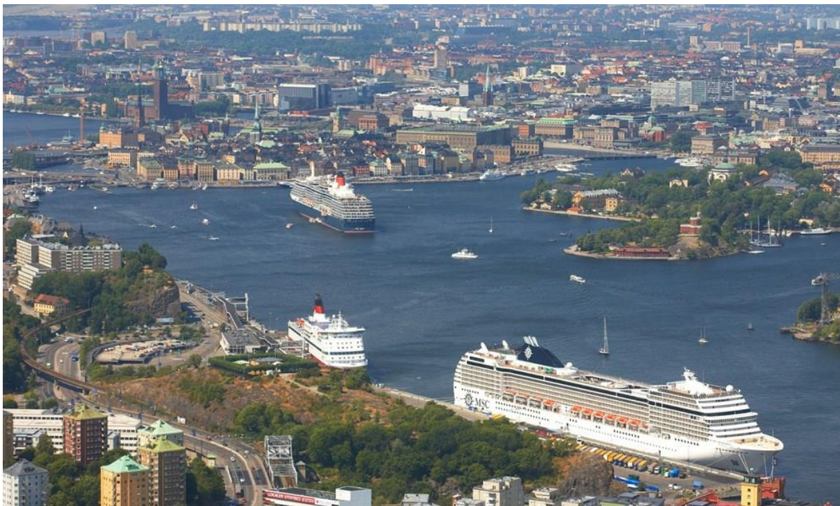
Slika 6: Terminal Nynashamn [7]

Između 2013. i 2016. godine obnovljena je cijela luka Vartahamnen s pet novih pristaništa s pametnim i ekološki prihvatljivim rješenjima te suvremenim putničkim terminalom.