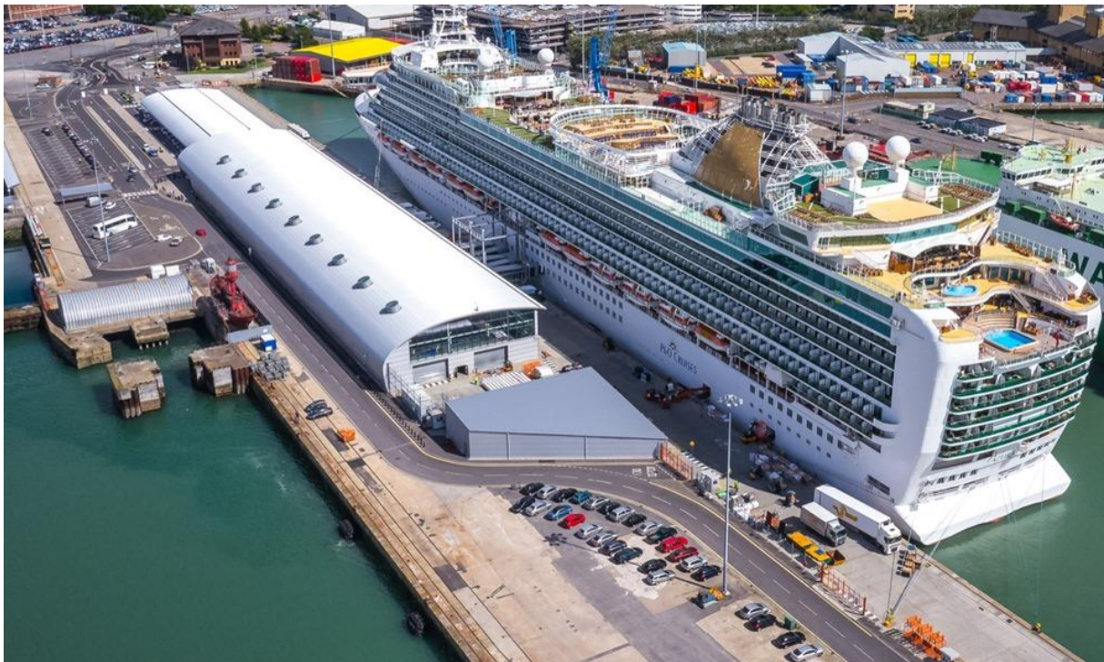
Slika 10. Ocean Cruise terminal [7]

Slika 10. prikazuje Ocean Cruise terminal. Ocean Cruise terminal otvoren je 2009. godine. Ima modernu građevinu, parkiralište za kratki boravak, bar, kafić, taxi.