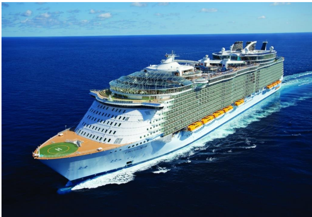
Slika 1. MS Oasis of the Seas [10]

Plovila se kategoriziraju na više načina, a mogu se podijeliti prema poslovnom modelu, veličini i načinu života putnika. Također, ovisno o dobi putnika kao i njihovim interesima i financijskoj slobodi, brodovi mogu biti namijenjeni za avanture, ugođaj, obrazovanje, kulturu, zabavu, sportske aktivnosti, wellness ili rekreaciju [5]. Slika 1. prikazuje brod za kružna putovanja MS Oasis of the Seas.