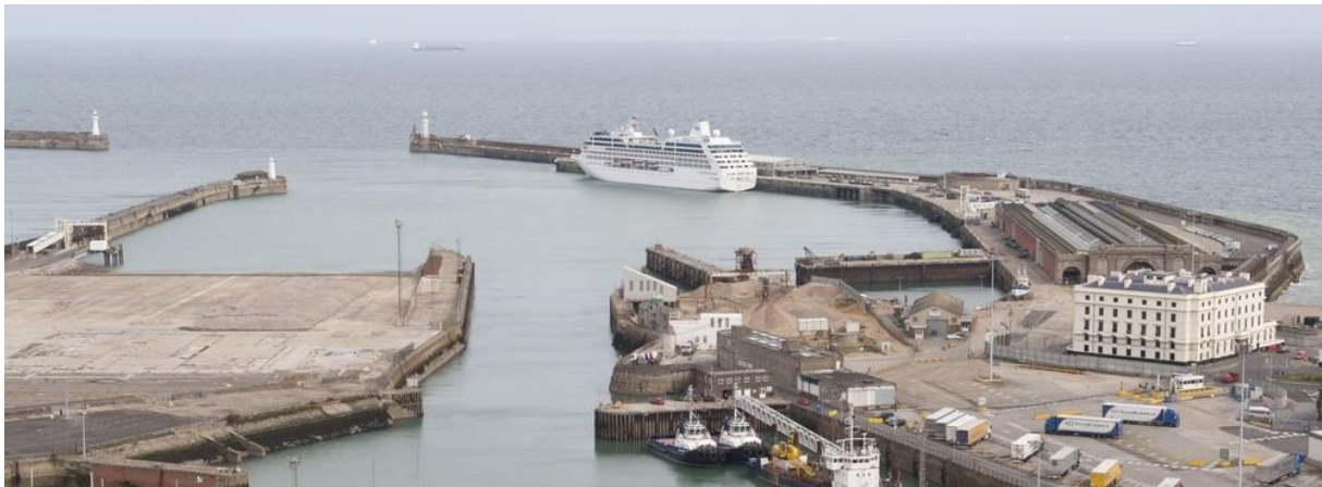
Slika 9. Terminal 2 za brodove za kružna putovanja [7]