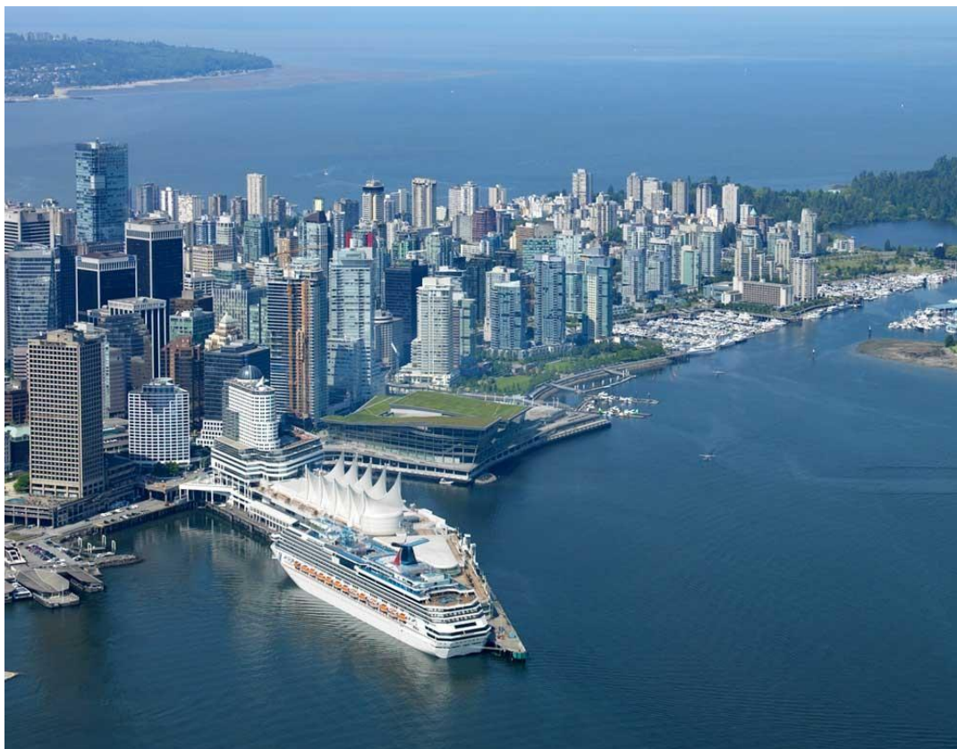
Slika 11. Canada Place terminal [7]