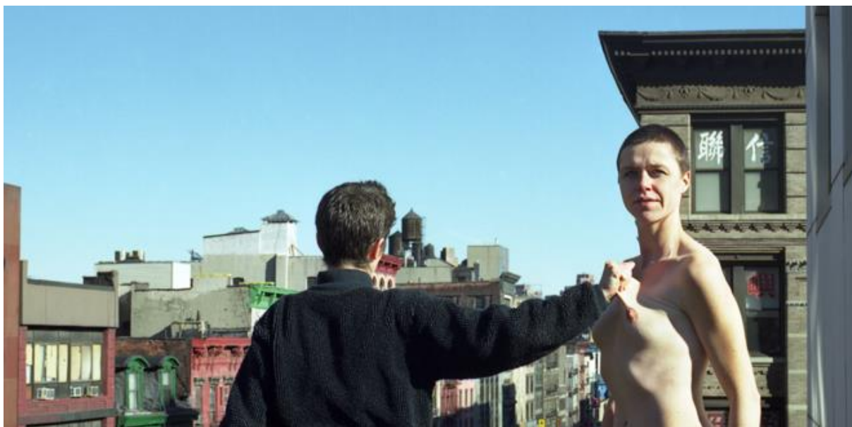
Melanie Manchot Gestures of Demarcation (2001.)