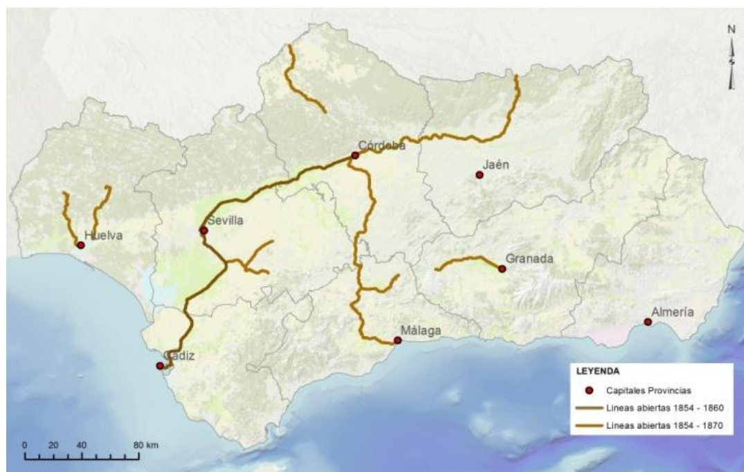
Fig. 3. Líneas de ferrocarril abiertas hasta 1870. Cerca de 985 km de vías en funcionamiento. Se contempla ya la base de la configuración que estructurará el territorio andaluz en el “primero impulso ferroviario”: los ejes mineros perpendiculares a la costa, el eje del Valle del Guadalquivir y las líneas agrarias. Verse el incremento significativo de vías en las provincias de Jaén, Málaga y Córdoba.