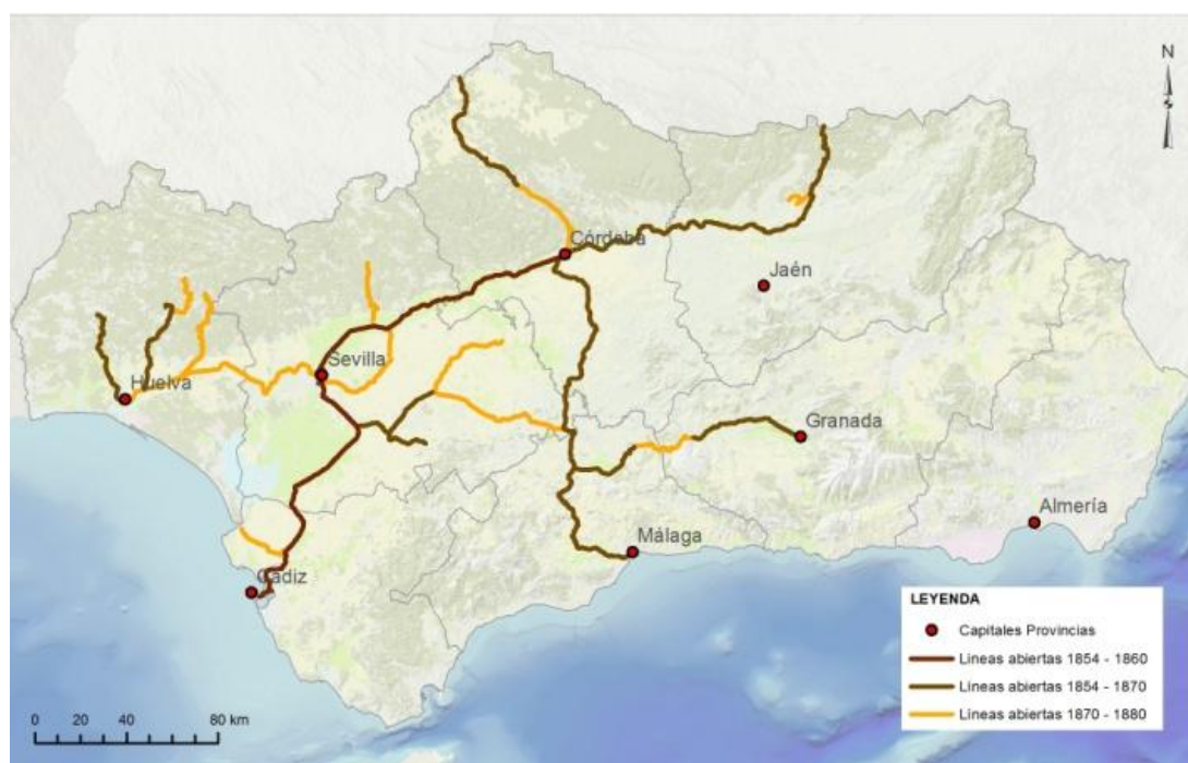
Fig. 4. Líneas de ferrocarril abiertas hasta 1880. Cerca de 1.545 km de vías en funcionamiento. Periodo conocido como “primero impulso ferroviario” (1854-1880). Se configura una relevante red ferroviaria motivada por tres “intereses” y/o “ejes” principales: [Málaga - Córdoba - Despeñaperros] daba continuidad a los tráficos hasta Madrid; el Ferrocarril del Valle del Guadalquivir y su extensión hasta la provincia de Huelva - minera y portuaria; y las líneas para el transporte interior de los productos agrarios y abastecimiento urbano. En la imagen se aprecia el considerable incremento de vías que han tenido las provincias de Huelva y Sevilla.