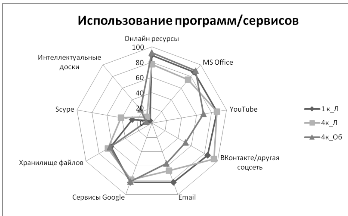
Рис. 1. Использование программного обеспечения/сервисов в личных целях(Л) и целях обучения(Об) студентами первого и четвертого курсов

На рисунке 1 ниже мы показываем виды программного обеспечения, к которому чаще всего обращаются учащиеся. Доминирующее положение занимают продукты, связанные с «онлайн-ресурсами»: переводчики, компиляторы, сервисы для создания презентаций и т.д. (в последовательности, представленной на рисунке: 89%; 77%; 92%).