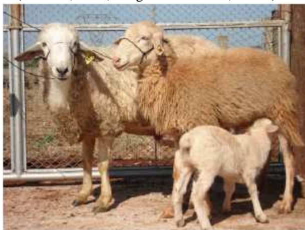
Figura 2. Ovinos pantaneiros (Oliveira, 2012). Imagem de Daniela Oliveira.

Um estudo exploratório foi iniciado em 2005 por pesquisadores da Uniderp (Anhanguera-Uniderp)– CTO, Embrapa, e, posteriormente, a UFGD, no intuito de identificar e manter esse grupamento genético, para evitar a extinção, pelo risco desta raça ser substituída por raças exóticas (Vargas Júnior et al., 2011a). Foram adquiridos 300 animais “pantaneiros” (Figura 2) provenientes de criações do alto (Planalto) e baixo pantanal (Pantanal) sulmatogrossense, selecionados por características fenotípicas semelhantes entre si, mas distante dos padrões fenotípicos das raças exóticas criadas no Brasil (Oliveira, 2012; Vargas Júnior et al., 2011a).