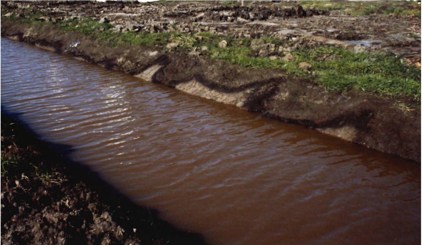
Fig. 3 Voorbeeld van een vegetatie-horizont nabij de stad Groningen.

Dit geesteskind van Ernst wordt nog regelmatig geraadpleegd, ook door nieuwe gebruikers van de ^{14}\text{C} -methode.