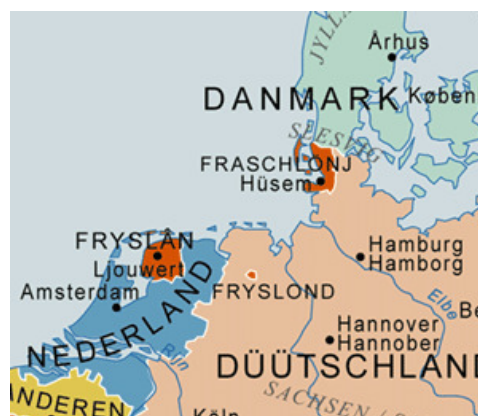
Het Bildts wordt alleen

Het Fries dat in Fryslân wordt gesproken wordt ook wel het West-Fries genoemd, omdat in delen van Duitsland en Denemarken een ander soort Fries wordt gesproken, het Ost-Fries en het Noord-Fries