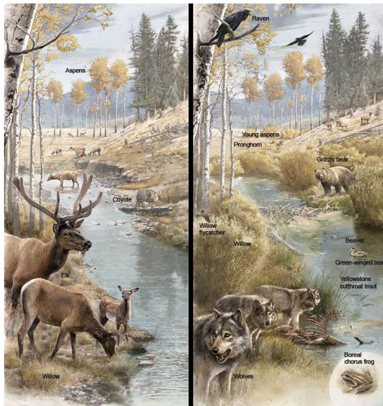
Slika 2. Lijevo - prije reintrodukcije vuka, desno – nakon reintrodukcije

Biološki resursi imaju široku primjenu u svakodnevnom životu - od uloge genetike u stvaranju novih kultivara preko vrsta koje se koriste za hranu, u medicini i u industrijske svrhe pa do kompletnih ekosistema koji pomažu procesima kao što su pročišćavanje voda i kontrola poplava. Bitno je imati na umu da su sve komponente bioraznolikosti međusobno povezane i odstupanje jednog segmenta iz ravnoteže dovodi cijeli sustav u disbalans, makar naočigled ne bismo povezali da će, primjerice, nestanak vuka iz ekosustava Yellowstonea dovesti do proširenja korita rijeke, značajnog smanjenja kvalitete vegetacije i gubitka mnogih vrsta (Timber Wolf Information Network, 2019) (slika 2).