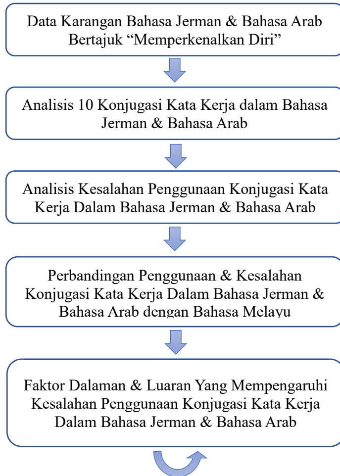
Jadual 5. Kerangka Teoretis Kajian