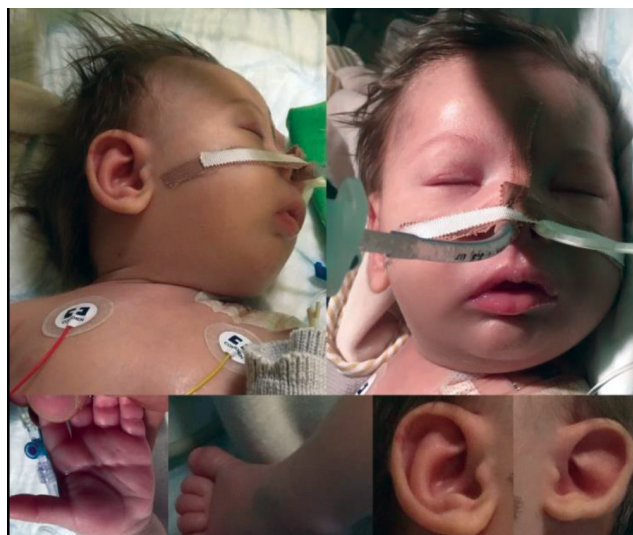
1. ábra | A gyermek minor anomáliái Brachycephalia, microcephalia , besüppedt orrgyök, lefelé konyuló ajkak, négyujjas barázda, II–IV. lábujjak syndactyliája , nagy fülek, aszimmetrikus fülkagylórajzolat

Zavartalan terhességből, lábtartás miatt császármetszéssel született a 40. terhességi héten 3050 g testtömeggel és Apgar 9/10-es statusban. Zavartalan korai adaptációt követően kétnapos életkorban otthonába bocsátották. Főbb fenotípusos eltérései kamrai sövényhiány