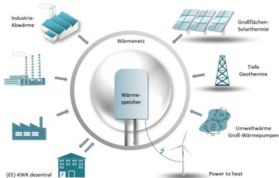
Abbildung: Wärmenetze als Plattform zur Einbindung verschiedener Wärmeströme

Wärmenetze als Plattformen eine Schlüsseltechnologie zur Steigerung der Energieeffizienz und des Anteils erneuerbarer Energien an der Wärmeversorgung in Städten, Quartieren oder ländlichen Regionen sein. In Kombination mit zentralen Wärmespeichern lassen sich so auch fluktuierende Energieträger in der Wärmeversorgung verlässlich nutzen und z.B. die solaren Deckungsgrade steigern.