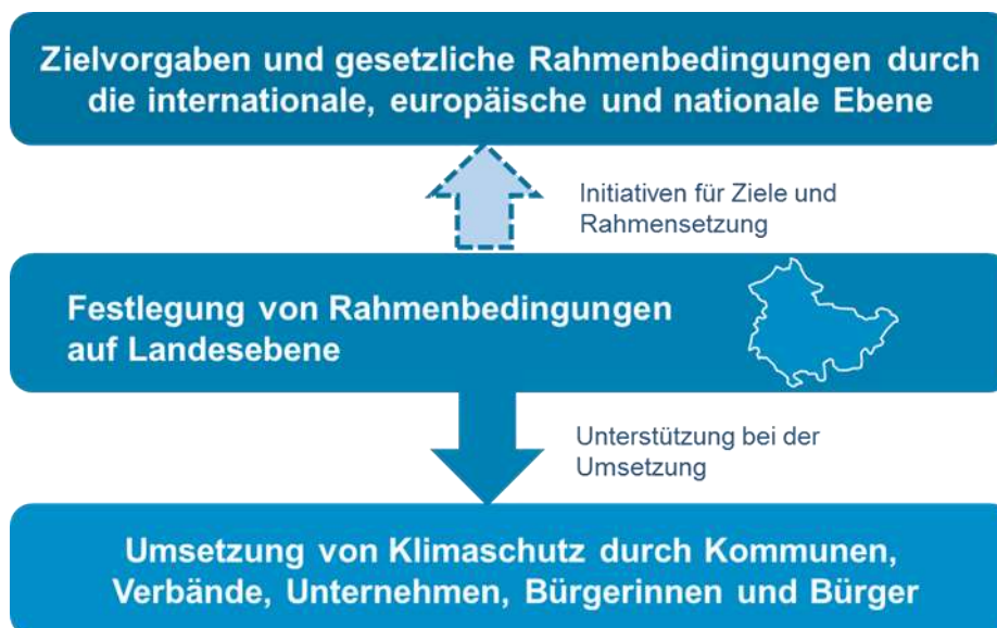
Abbildung: Gestaltungsspielraum des Freistaates Thüringen in der Klimaschutzpolitik

Bei der Gestaltung der Energie- und Klimaschutzpolitik des Freistaates Thüringen müssen die oben beschriebenen Zielvorgaben auf internationaler und nationaler Ebene und die damit verbundenen Rahmense tzungen berücksichtigt werden. Die Aktivitäten der Landesregierung zur Senkung der Treibhausgasemissionen sind aber nicht nur eingebettet in die klimapolitischen Aktivitäten der internationalen Staatengemeinschaft, der Europäischen Union und der Bundesebene, sondern auch in die Aktivitäten der kommunalen Ebene, von Unternehmen und von Bürgerinnen und Bürgern.