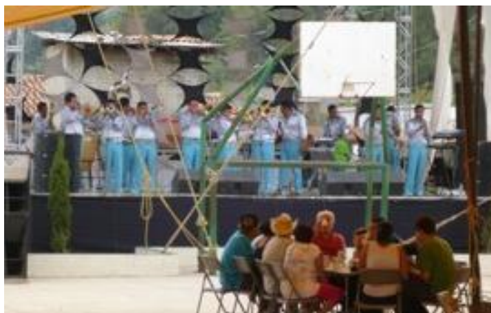
Imagen 1. Familiares y amigos conviviendo durante la fiesta patronal

A pesar de los diversos vínculos económicos y sociales que involucra la organización de la fiesta, de momento pareciera que se tratara de poblaciones separadas o divididas, con intereses muy diferentes. No obstante esta división, el ambiente que se vive durante la fiesta parece dejar atrás las diferencias e intereses desarticulados, pues aquí es cuando las visitas temporales de los migrantes trascienden de una práctica económica a una práctica social, familiar y comunitaria que revive los vínculos, permite los reencuentros y la convivencia entre una misma población (ver Imagen N° 1).