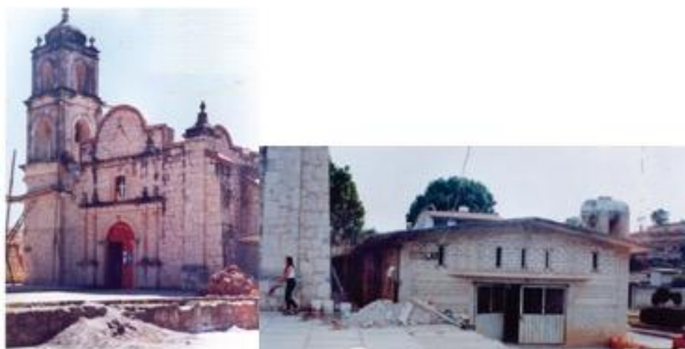
Imagen 2. Ampliación de la Iglesia de la Santa Cruz y salón