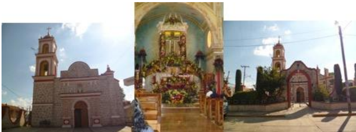
Imagen 3. Restauración de la Iglesia de la Santa Cruz