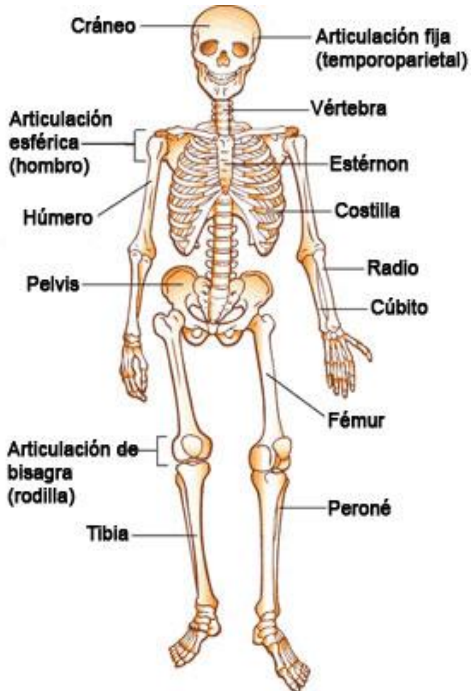
Figura 2: Partes del Sistema Óseo