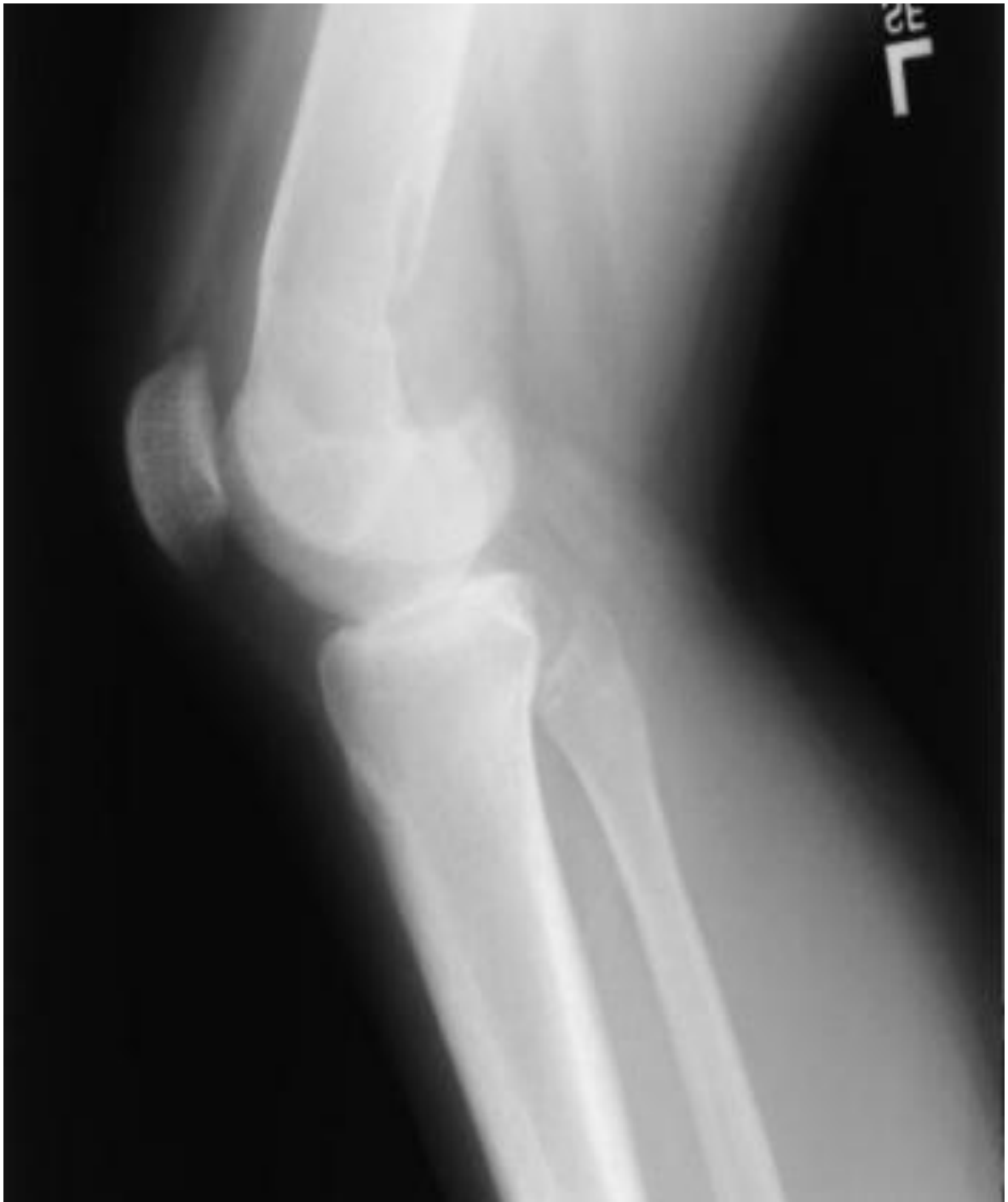
Figura 4: Radiografía de Osteosarcoma