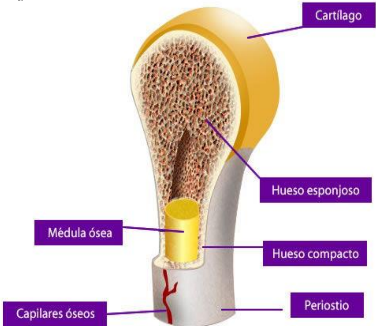
Figura 1: Partes del Hueso