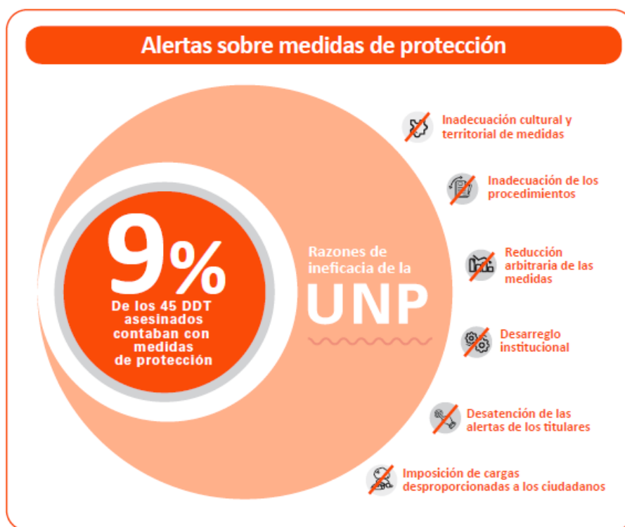
Figura 2. Alertas en medidas de protección de líderes sociales o Defensores de Derechos Territoriales. Procuraduría General de la Nación (2018).

a líderes sociales, resulta lenta y poco efectiva, como se evidencia en la figura 2 que se muestra a continuación: