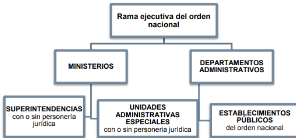
Figura 1. Sujetos obligados en materia de abogacía de la competencia