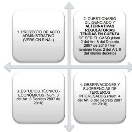
Figura 2. Documentos para trámite de abogacía de la competencia en la SIC