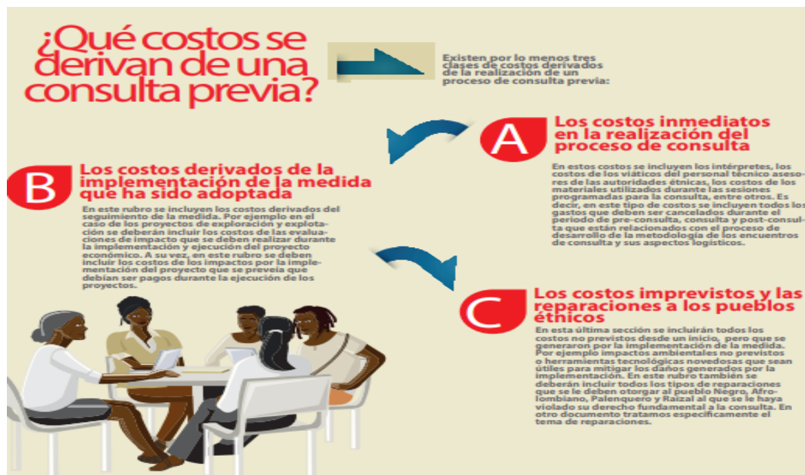
Figura 4. Costos derivados de la Consulta Previa

Estos procesos representan unos costos adicionales que se derivan del proceso de consulta previa, los cuales se logran evidenciar de manera concreta en la figura 4 que se muestra a continuación.