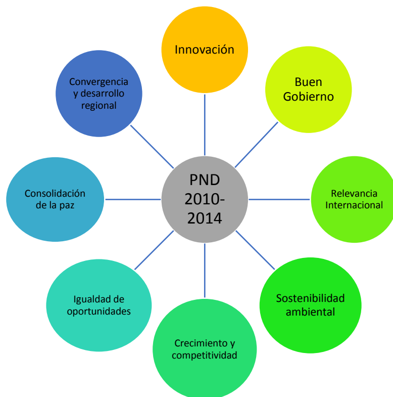
Figura 1. Ejes Plan Nacional de Desarrollo 2010-2014 Prosperidad para todos