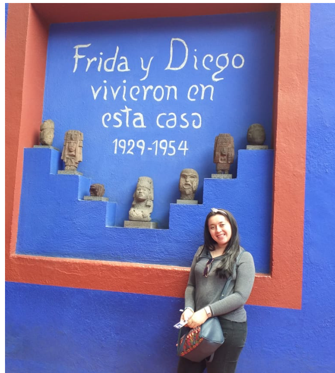
Museo de Frida Kahlo. en la calle de Londres 247, en uno de los barrios más antiguos de la Ciudad de México, el centro de Coyoacán.