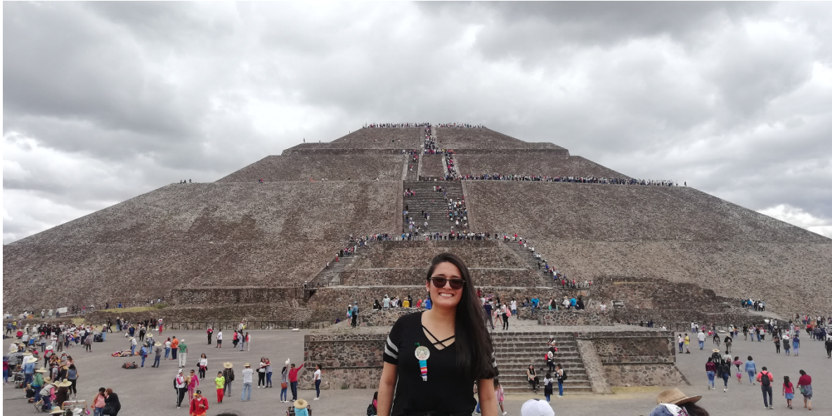
Teotihuacán. Fotografía de Angie Rodríguez tomada en frente a la pirámide del sol desde una de las mayores ciudades prehispánicas de Mesoamérica.