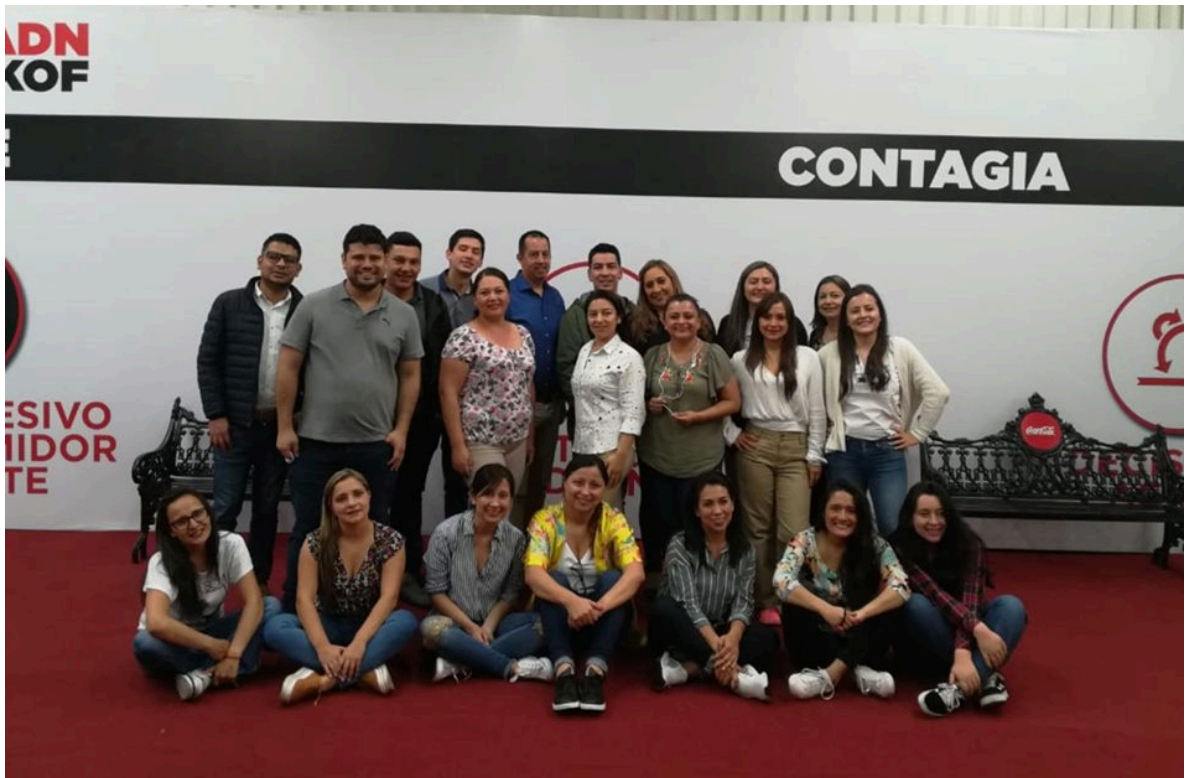
Coca-Cola. Fotografía tomada en la visita empresarial a la fábrica de Coca Cola Femsa en León, México.