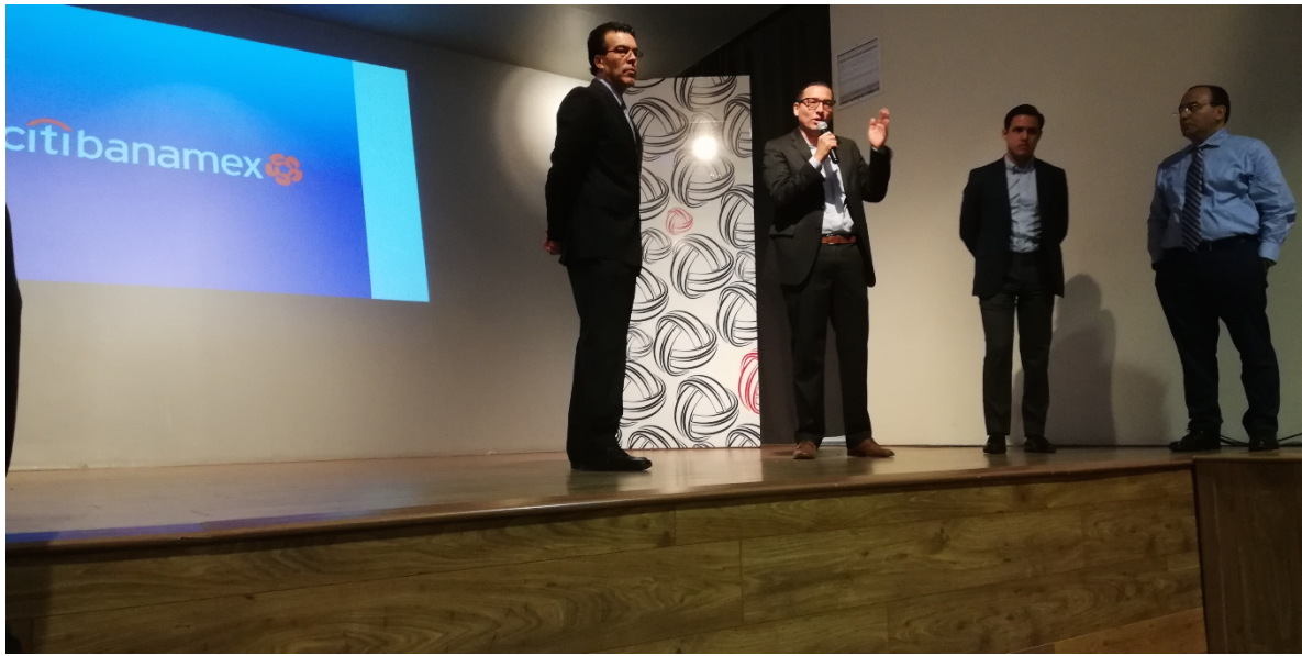
Citi-Banamex. Fotografía tomada en la conferencia realizada por los directivos del Banco Citi-Banamex en la Universidad de la Salle Bajío.