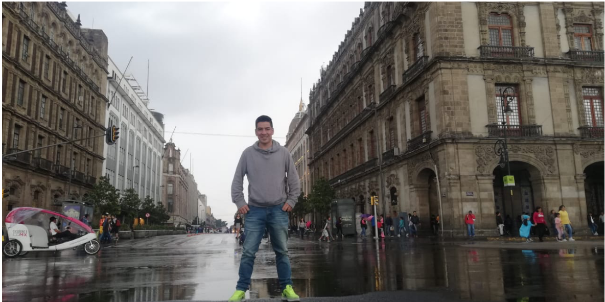
Ciudad de México. Fotografía de Ferney Melo en el centro histórico de la ciudad de México.