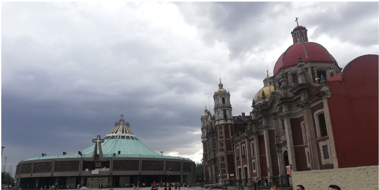
Basílica de Santa María de Guadalupe. Fotografía tomada durante el recorrido al santuario de la Iglesia católica.