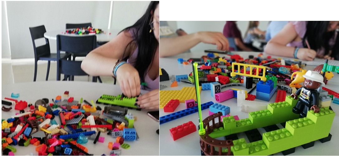
Lego. Fotografías de la actividad realizada en el Parque de Innovación en la Universidad de la Salle Bajío.